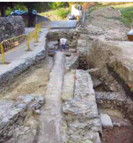
Opraving van het Romeinse forum in Llívia (2016).

Vandalen en andere Germaanse stammen hebben Llívia en omstreken op hun doortocht verwoest. Cerdanya werd vervolgens