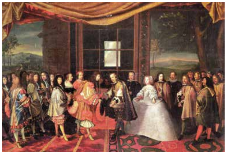
Afronding van het Verdrag der Pyreneeën.

Wat in 1648 de Vrede van Münster voor Baarle betekende, was het Verdrag der Pyreneeën in 1659 voor Llívia. In de zeventiende eeuw was heel Europa betrokken bij de Dertigjarige Oorlog.