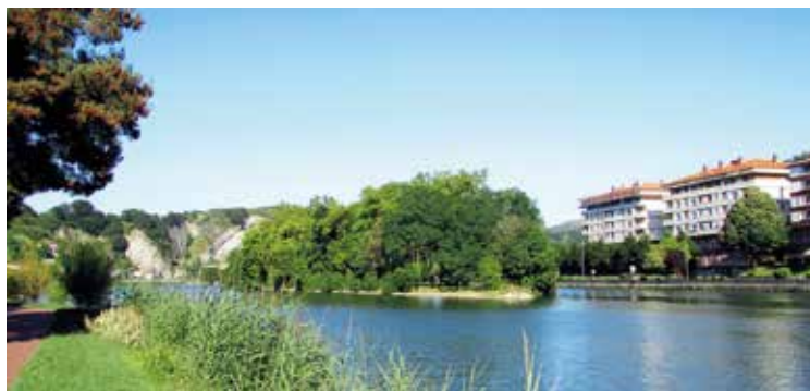
Nu groeien er bomen op het eiland. www.blogspot.com

Meer dan twee eeuwen verstreken voor de rijksgrenzen bij Llivia werden vastgesteld. De gemeentegrenzen van Llivia werden lange tijd gemakshalve als rijksgrenzen beschouwd, wat vaak tot problemen leidde. Alleen de eeuwenoude 'Pedra Detra' – een steen die stond op de huidige locatie van grenssteen nummer 1 – werd door beide landen als grenssteen erkend. In het derde Grensverdrag van Bayonne, ondertekend op 26 mei 1866, werden de rijksgrenzen van Llivia officieel vastgelegd. Twee jaar later werden de grenzen met vijftienvertig palen afgebakend. Sommige van deze grenspaaltjes staan er nog, andere zijn vervangen door een nieuwe steen. Aan de Spaanse kant vermelden zij de letters LL van Llivia, aan de Franse kant