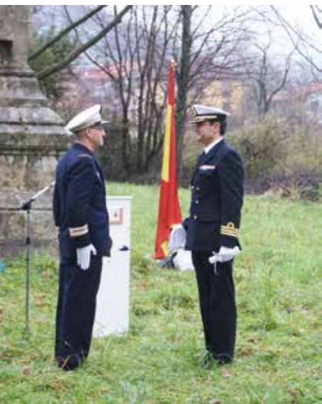
Spaanse en Franse marinecommandant bij de overdracht.

bevindt. Alle andere gebieden met een gezamenlijke soevereiniteit bevinden zich op het water. In 1995 had zo'n condominium voor het tot dan toe betwiste gebied in Ulicoten overwogen kunnen worden. Maar dat is toen niet gebeurd. Nu is dat stukje niemandsland gewoon de tweeëntwintigste enclave van Baarle-Hertog.