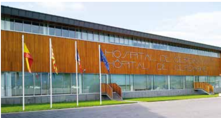
Grensoverschrijdend ziekenhuis.

De samenwerking tussen de administraties van Catalonië en Frankrijk leidde tot het eerste ziekenhuis in Europa dat grensoverschrijdend