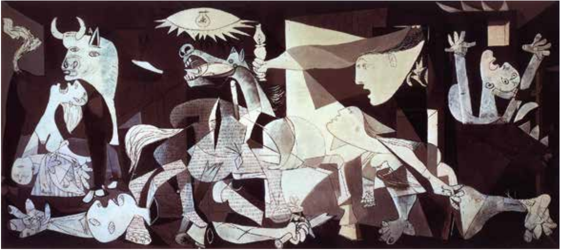
Duitsland kwam Franco ter hulp. Pablo Picasso schilderde het Duits bombardement op Guernica. https://kunstvensters.com

Hetzelfde probleem deed zich vanaf 2001 voor op het kruispunt van de neutrale weg met de Franse D30. Hier werd een rotonde aangelegd, waartegen in de enclave tevergeefs fel werd geïmagineerd. Sinds die werken staan Llivia en Puigcerdà ook op de Franse verkeersborden aangeduid. Lange tijd stonden in Frankrijk geen wegwijzers naar beide Spaanse steden. Tot de afschaffing van de grenscontroles in 1995 was het immers verboden de neutrale weg op Frans grondgebied te verlaten of op te rijden.