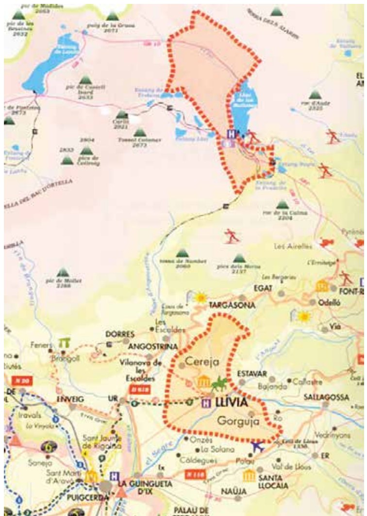
Eigendommen van Llívia in Frankrijk (bovenaan). https://fronterasblog.com

In 1866 werden afspraken gemaakt om het leven van de bewoners aangenamer te maken. Het derde Grensverdrag van Bayonne vergemakkelijkte de doorgang van de kuddes via het Franse dorp Angoustrine. Maar in de jaren 1970 ontstond een grensconflict tussen Frankrijk en Spanje omdat