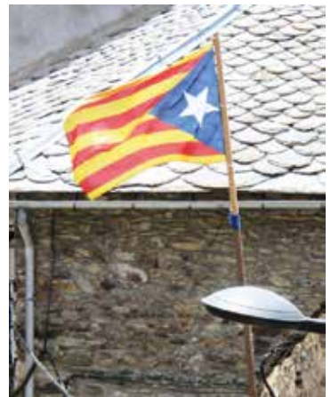
La Estelada, vlag van de burgerlijke onafhankelijkheidsbeweging.

Frankrijk door Duitse troepen, veroorzaakte in de enclave een zeer ongemakkelijke situatie. Duitsers patrouilleerden rond de enclave en de Duitse regering stuurde een verzoek aan Madrid om de gebeurtenissen in de enclave van nabij op te volgen. Llivia kon door de enclavesituatie immers een verzets- en spionagenest worden. Meer dan honderd gewapende Spaanse politieagenten arriveerden in Llivia, dat destijds zevenhonderd inwoners telde.