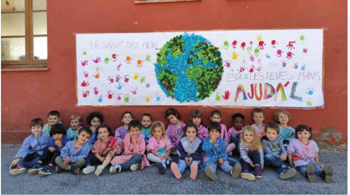
Kleuters van Llivia groeten de wereld. https://sagora.xtec.cat

In ieder geval heeft Llivia maar weinig kenmerken van het gastland Frankrijk overgenomen. In 1979 besliste de stad zelfs dat geen enkele Fransman onroerend goed in de enclave mocht hebben. Wanneer hij dat zou erven, moest het onmiddellijk aan een Spanjaard verkocht worden. Maar met het openen van de Europese grenzen hield deze beslissing niet lang stand. In 1999 waren er al vijftig Franse eigenaren in Llivia.