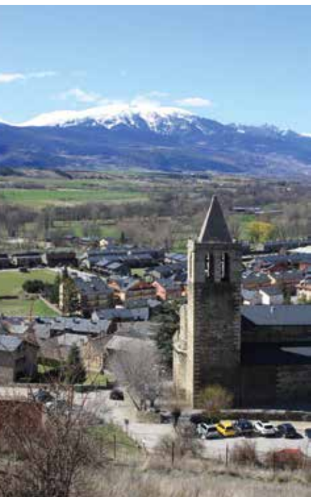
Kerk van Llivia. http://rutesiexcursion-sperlacerdanya.blogspot.com

De inwoners van Llivia beschouwen hun stad als de geboorteplaats van Catalonië. De middeleeuwse graaf Sunifred, die in Llivia resideerde, stond immers aan de basis van de huidige Catalaanse identiteit. Tijdens het Catalaanse onafhankelijkheidsreferendum op 1 oktober 2017 stemden