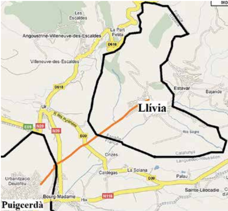
Neutrale weg (oranje lijn). https://fronterasblog.com