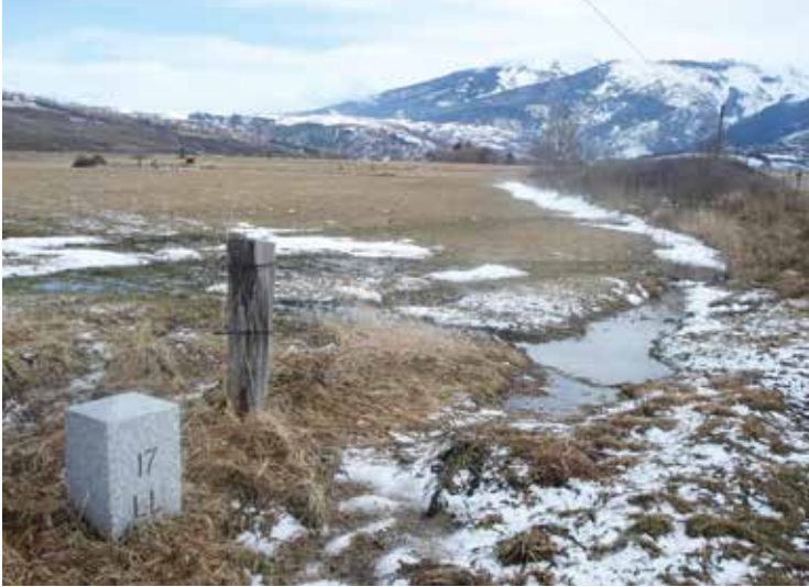
Grenssteen 17. https://fronterasblog.com