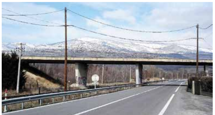
Brug over de Franse N20. https://fronterasblog.com

neutrale weg kruisten. Vooral het kruispunt met de drukke Franse N20 was levensgevaarlijk omdat Spanje het bestaansrecht van die weg in twijfel trok. Stelde het derde Grensverdrag van Bayonne immers niet dat Spanjaarden zich via de neutrale weg ongehinderd over twee kilometer Frans grondgebied van de Spaanse enclave naar het Spaanse vasteland mogen verplaatsen? 'Ongehinderd' betekent voor de Spanjaarden dat zij op het kruispunt met de N20 niet moeten stoppen. Ze hebben er altijd voorrang. Dit leidde in 1973 tot problemen omdat Frankrijk van de drukke N20 een voorrangsweg maakte. Al snel vielen de eerste dodelijke slachtoffers, want de Spanjaarden weigerden resoluut om voorrang te verlenen aan Franse weggebruikers die vanuit de 'zijwegen' kwamen. Stopborden werden herhaaldelijk vernield. Dat eindigde pas toen de Franse gendarmes die permanent ging bemannen! De conflicten werden beoordeeld door een tribunaal dat speciaal was ontworpen om dergelijke zaken te behandelen. Uiteindelijk werd in 1983 een viaduct over de N20 aangelegd. Het bouwen ervan werd door Spanje betaald, het onderhoud gebeurt door Frankrijk.