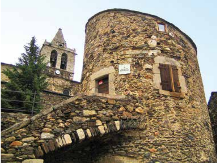
Toren van Bernat de So, met daarachter de kerktoren.

deren in het gemeentelijk museum van Llivia, naast de Torre Bernat de So. De apotheek bezit een van de belangrijkste collecties receptenboeken in Europa.