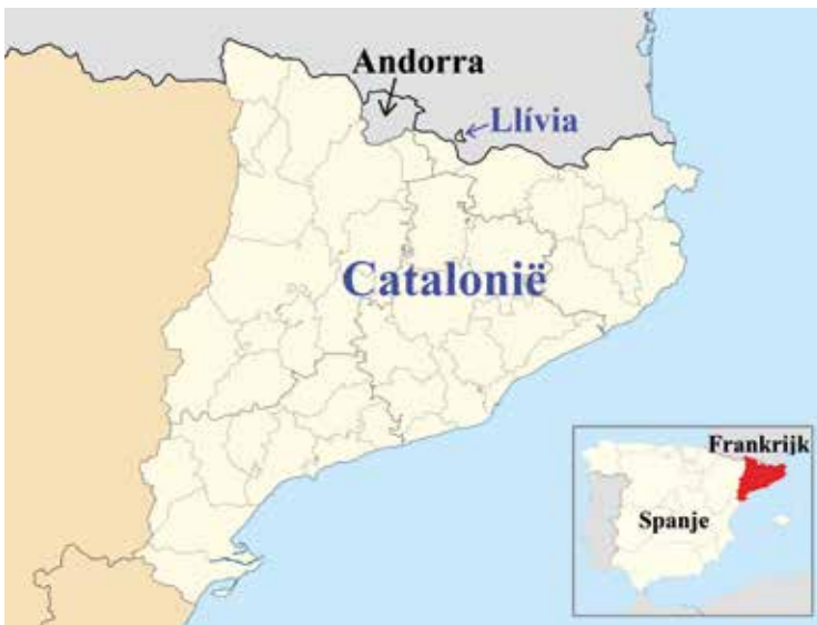
Ligging van Llivia. www.wikimedia.org

Het typische bergstadje ligt op een hoogte van 1.224 meter, ongeveer achttien kilometer ten oosten van Andorra. Llivia, behoort tot de historische landstreek Cerdanya, waarvan het tussen 815 en 1177 de hoofdstad was. Cerdanya heeft als enige Pyreneeënregio een natuurlijke route langs rivieren om met legers of koopwaar gemakkelijk het gebergte over te steken. Llivia is altijd een belangrijk controlepunt op deze route geweest.