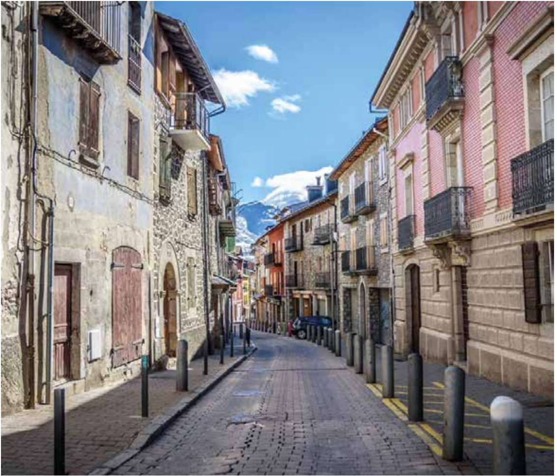
Oud stadscentrum. https://natakallam.com

werkt. Het Cerdanya-ziekenhuis in Puigcerdà werd opgericht vanuit de Europese Vereniging voor Territoriale Samenwerking, een nieuwe publiekrechtelijke entiteit. Het bescheiden ziekenhuis zorgt sinds 2014 voor de bevolking van de regio's Cerdanya (Spanje) en Capcir (Frankrijk), waarbij het beste van elk van de twee gezondheidssystemen wordt toegevoegd. Het biedt acute ziekenhuisopnames en gespecialiseerde en spoedeisende hulp aan een populatie van 32.000 mensen (zo'n 130.000 in de toeristische seizoenen). Ook steeds meer Franse patiënten komen langs zodat