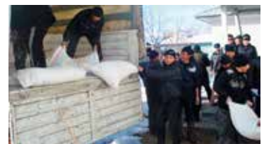
Noodhulp aan de enclave Barak (januari 2013).

Het effect hiervan was goed merkbaar voor de enclavebewoners. Zij voelen zich als schipbreukelingen op een eiland. Alleen inwoners van Barak worden door Oezbeekse grenswachters nog in de enclave toegelaten. Hun pas wordt gecontroleerd en hun naam gecheckt op een inwonerslijst. Familieleden mogen de grens niet passeren, zelfs niet voor een bruiloft of een begravenis. De kleine gezondheidskliniek kan geen ernstige gevallen meer opnemen bij gebrek aan materiaal. En wanneer de grens gesloten is, kunnen de patiënten niet meer voor verzorging naar hun thuisland vervoerd worden. Telkens wanneer er een aanslag is in Oezbekistan of een grote betoging in Kirgizië,