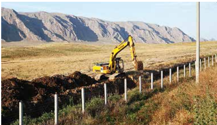
Oezbeekse kraan graaft een gracht langs de grens (juli 2010).

Begin oktober 1999 plaatste het Oezbeekse leger landmijnen. Bruggen werden vernield en er kwamen wachttorens, dode zones en een twee meter hoge prikkeldraadversperring met een gracht en een wal langs de grens met Kirgizië. De strategie van het unilateraal veiligstellen van de grens sloot