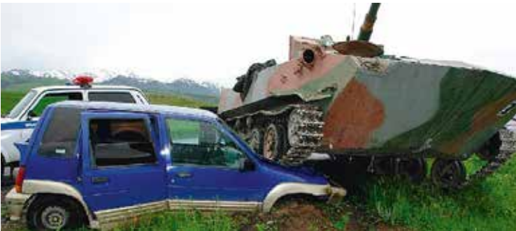
Auto in Sokh door een militair gepantserd voertuig verpletterd. http://zanoza.kg

De corridor zou het westen van de provincie Batken volledig van de rest van Kirgizië loskoppelen, gezien de hoge bergpassen ten zuiden van Sokh en de onmogelijkheid om een alternatieve weg aan te leggen ten noorden ervan. Momenteel bevindt zich daar een rondweg die Batken met de rest van het land verbindt en die de enclave vermijdt. Jammer genoeg ligt de weg op een aantal plaatsen in betwist gebied. Ook is het land dat Oezbekistan in ruil aanbiedt niet geschikt voor de landbouw. Het is met andere woorden van onevenredig lage waarde.