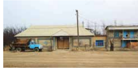
Gebouwen nabij Dzjangail.

Dzhangail (Jani-Ayil of Jangy-ayyl) is een kleine Oezbeekse enclave ten noordwesten van Shakhimardan. De enclave wordt omsloten door het Kirgizische dorp Khalmion. Dzhangail is lokaal bekend om zijn grote bazaar, perziken en abrikozen. Landbouw blijft een van de belangrijkste activiteiten van de bewoners. Van sommige huizen ligt de living in Oezbekistan en het terras in Kirgizië. De afstand naar het thuisland bedraagt slechts 760 meter en de oppervlakte van de enclave 1,445 km 2 . Er wonen ongeveer duizend mensen en zij leven nog heel traditioneel in hun geïsoleerde wereld. De ouders hebben bijvoorbeeld het laatste woord bij het huwelijk van hun kinderen. De jongste zoon moet in het dorp blijven wonen en zijn vader bouwt een huis voor hem.