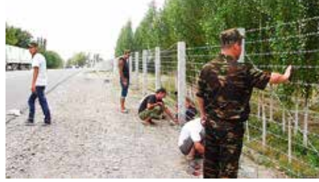
Grensversperring tussen Oezbekistan en Kirgizië. https://rus.ozodlik.org

In augustus 2016 verhuisden nog eens 140 inwoners van de enclave naar hun thuisland. Zij konden terecht in het nieuw opgerichte dorp Besh-Uy, samen met inwoners van Chaichi wiens huizen in 2015