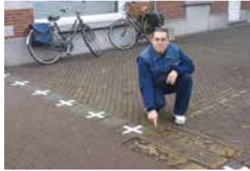
Baarle, el pueblo de mil fronteras.

gesmaakte toeristische trekpleister. Lees maar eens hoe Diego González, een enclaveliefhebber, op 7 oktober 2016 als buitenlander onze enclaves en de Enclavefietsroute heeft ervaren: