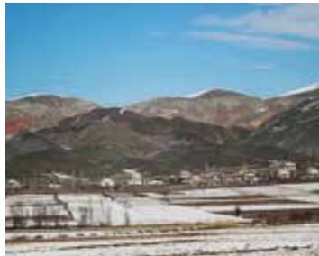
Khalmion, Kirgizisch dorp rondom Dzjangail. http://francevasion.org

lingen vrij van visa in de enclave kunnen reizen. Shakhimardan zou een toeristische bestemming zijn, wat betwijfeld kan worden gezien de complexiteit bij het passeren van de grenzen en het gebrek aan toeristische infrastructuur. De toeristisch gerelateerde economie van Shakhimardan lijdt onder de grensincidenten en het geruzie over de enclavegrenzen. Het economisch welzijn van de bewoners is in gevaar.