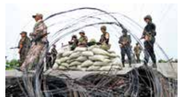
Grensbewaking tussen Oezbekistan en Kirgizië.