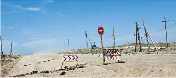
U nadert niemandsland. Toegang op eigen risico. www.eurasianet.org

Van 5 tot 7 januari 2013 was Sokh het epicentrum van een conflict tussen enclavebewoners, Kirgizische grenswachten en bewoners van naburige Kirgizische dorpen. Als gevolg hiervan werden grensposten en spoorverbindingen door de Oezbeekse overheid gesloten. Kirgistan voorspelde dat het van Sokh een reservaat zou maken door het met een betonnen muur te omringen. Als vanzelf werd ook de toegang tot de verderop gelegen Shakhimardan enclave afgesloten. Oezbekistan reageerde met het afsluiten van de Barak enclave. De regering van Kirgizië liet zieke of zwangere inwoners van de dorpen die Sokh omringen met helikopters naar het ziekenhuis overbrengen. Oezbekistan kon via de autoweg evenmin burgers uit de getroffen enclavedorpen hulp aanbieden, tot beide regeringen overeenkwamen om hulpkonvoien op elkaars