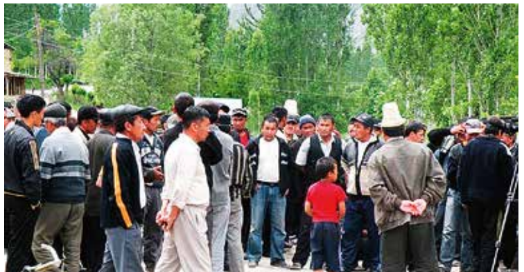
Toenemende spanning bij de inwoners van Sogment.

In 1996 bezegelden Oezbekistan en Kirgizië in een memorandum hun eeuwige vriendschap, maar desondanks bleef de relatie tussen de twee landen een uitdaging op het gebied van handel, waterbeheer, grensafbakening en etnische conflicten, met inbegrip van de enclavekwesaties. In 2010 moesten tijdens etnische conflicten in de Kirgizische stad Osh ook in de enclave Sokh meer dan tweehonderd Kirgizische bewoners vluchten voor het geweld.