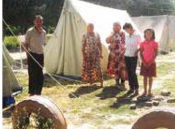
Vluchtelingen uit Barak worden tijdelijk in Ak-Tash opgevangen (2011).

In 2010 waren er in het zuiden van Kirgizië conflicten tus-