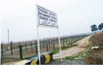
Grens met Oezbekistan. http://dontstopping.net

het gemak om in en uit de enclaves te reizen, de economische ontwikkeling, een juridische oplossing voor de enclavekwessie en de algemene bilaterale betrekkingen tussen de betrokken staten. Het welzijn van de inwoners moet centraal gesteld worden. Eeuwenlang werd in de Fergana Vallei handel gevoerd zonder grensbepalingen. Die werden pas ingevoerd na het uiteenvallen van de Sovjet-Unie. Is een soort van vrijhandelszone voor deze landen een mogelijke oplossing? In dat geval moeten de Centraal-Aziatische landen hun culturele en historische banden beklemtonen. Hun overeenkomsten in plaats van hun verschillen. Dat is een proces van lange adem. Het voortbestaan van de Centraal-Aziatische enclaves is helemaal niet verzekerd. Corridors kunnen op meerdere plaatsen de enclave-situatie opheffen, al lijkt die optie moeilijk haalbaar. Enclaves kunnen eventueel ook uitgewisseld worden. Een vreedzaam samenleven in en nabij de enclaves lijkt echter ver weg. Daarvoor is er te weinig onderling vertrouwen. En gezien de aanwezige spanningen, moeilijke of verboden grenspassages, hekken, grachten, wallen en landmijnen zijn deze acht enclaves absoluut niet geschikt als toeristische bestemming!