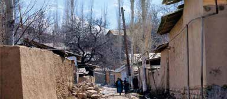
Dorp Cox in de enclave Sokh.

als dusdanig erkend. Kirgizisch of Oezbeeks? In feite kunnen drie landen op de enclave aanspraak maken. Sokh is de enige enclave ter wereld waar de bewoners niet dezelfde etnische afkomst hebben als de landen die het gebied voor zich opeisen. 99% van de bevolking spreekt namelijk... Tadzjiks, ook al heeft iedereen een Oezbeeks paspoort! Slechts een zeer kleine minderheid spreekt Kirgizisch (1%) en Oezbeeks wordt er nauwelijks gesproken. De opvoeding en het onderwijs gebeurt in het Tadzjiks, al is dat geen officieel erkende taal in Oezbekistan. De plaatselijke krant ('De Stem van Sokh') verschijnt in het Tadzjiks. De contacten met Tadzjikistan zijn zeer beperkt omwille van de gespannen relaties tussen de twee landen, de strenge visa regelingen en het gebrek aan goede verkeersverbindingen. Tadzjikistan heeft voornamelijk geen claims op de enclave gelegd. De overheid vindt dit zinloos omdat Sokh over de Tadzjiekse bergpassen nauwelijks bereikbaar is. Ook via het spoor is er geen verbinding mogelijk. Tijdens het Sovjetbewind maakte Tadzjikistan lange tijd deel uit van de Oezbeekse Sovjet Socialistische Republiek. Sokh kwam toen onder Oezbeeks bestuur en bleef Oezbeeks toen Tadzjikistan een aparte Sovjetrepubliek werd.