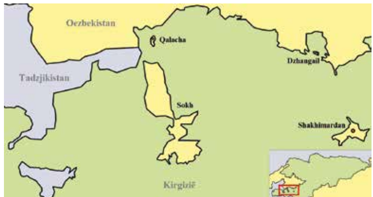
Enclaves van Oezbekistan. www.reddit.com

Zowel Kirgizië als Oezbekistan eisen het grondgebied voor zich op. Oezbekistan erkent zelfs het omringende grondgebied niet als behorend tot Kirgizië. Sokh is dus een enclave op de-facto basis: ze bestaat als enclave, al wordt ze door de twee betrokken landen niet