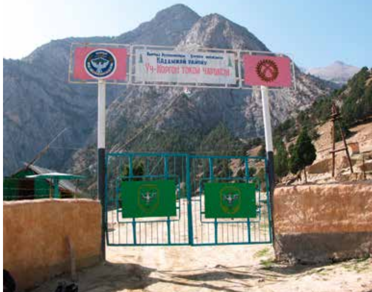
Enclavegrens in Shakhimardan.

ling tot Sokh geen conflictgebied. Qalacha maakt deel uit van een mogelijke corridor naar de grote enclave Sokh. Aan beide uiteinden in de enclave liggen de dorpen Qalacha en Chon-Qora. Er wonen ongeveer duizend Oezbeken op een oppervlakte van twee à drie vierkante kilometer. Het thuisland is slechts 2,3 km verwijderd.