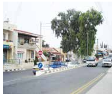
Centrum van Xylotymbou.

overlevenden van de Holocaust de verschrikkingen van nazi-Europa te ontvluchten. Zij begonnen aan een clandestiene reis naar het Britse mandaatgebied Palestina, meestal vanuit Italiaanse havens. In augustus 1946 zette de Britse regering in haar kroonkolonie Cyprus interneringskampen op, bedoeld voor mensen zonder visum. In twee dorpen kwamen in totaal twaalf campings die plaats boden aan meer dan 52.000 mensen. Eén van die dorpen was Xylotymbou. In die interneringskampen werden meer dan 2.000 kinderen geboren. In februari 1949 werden de kampen gesloten.