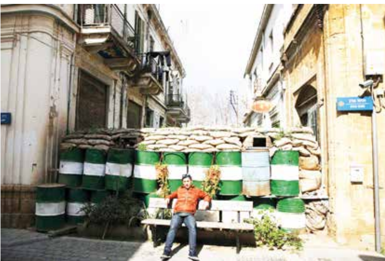
Grensversperring in Nicosia.

De Turks-Cyprioten stemden vóór het plan in de hoop van zo een einde te maken aan de internationaal geïsoleerde positie en de eco-