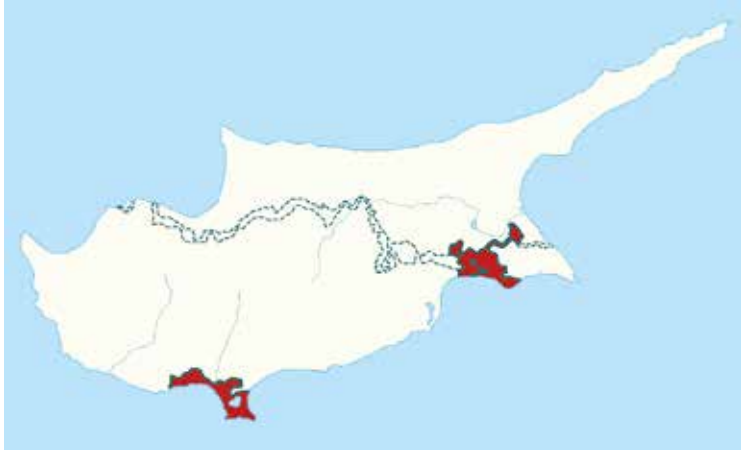
Rood ingekleurde legerbases: Akrotiri (links) en Dhekelia (rechts).

Samen beslaan de Britse legerbases drie procent van Cyprus. Naast militaire installaties zoals een vliegveld en afsluisterapparatuur omvatten ze ook woonwijken en landbouwgronden. Zestig procent van de bases is privé-eigendom. Veertig procent wordt gecontroleerd door het Britse ministerie van Defensie, deels als eigendom van de Britse kroon. De Royal Air Force gebruikt de bases o.a. als tussenstation voor vluchten naar het verre oosten en voor de opleiding en training van piloten. Voor alle duidelijkheid: Akrotiri en Dhekelia zijn géén en-