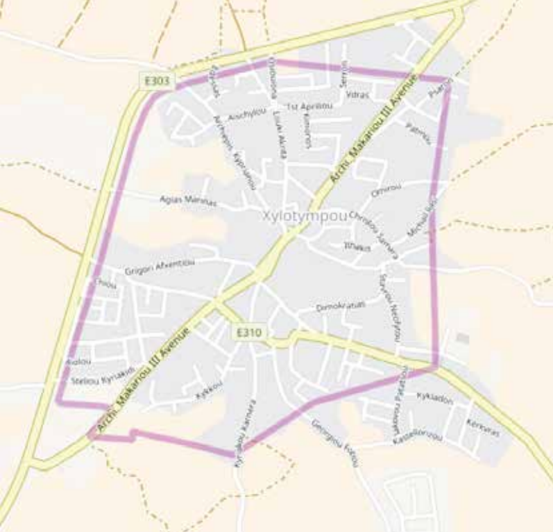
Xylotymbou barst uit zijn voegen. Heel wat huizen staan op Brits grondgebied. www.google.com

aardbeving en plunderende barbaarse indringers ten onder ging. In de 12 de en de 14 de eeuw werden kerken gebouwd bij de grotten uit het pre-christelijke tijdperk. Daarna