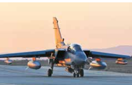
Brits Tornadoestel op het vliegveld van Akrotiri.

Volgens het verdrag van Londen moet de Britse overheid voor haar legerbases jaarlijks huur betalen aan Cyprus. De gebieden bevinden zich namelijk op zeer aantrekkelijke plaatsen aan de kust, met directe toegang tot de Middellandse Zee. Als gevolg hiervan kunnen de Cyprioten er niet investeren in hun toeristische infrastructuur. Vier jaar lang werd die huur betaald, maar na 1964 stopte dit omdat de Britten beweerden geen garantie te krijgen dat zowel de Turkse als de Griekse gemeenschap evenre-