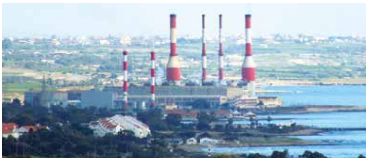
Elektriciteitscentrale van Dhekelia.

De eerste elektriciteitscentrale werd hier in het midden van de vijftiger jaren gebouwd. Die is intussen helemaal ontmanteld en tussen 1982 en 1993 vervangen door zes stoom eenheden van elk 60 MW, die zware stookolie verbranden. De