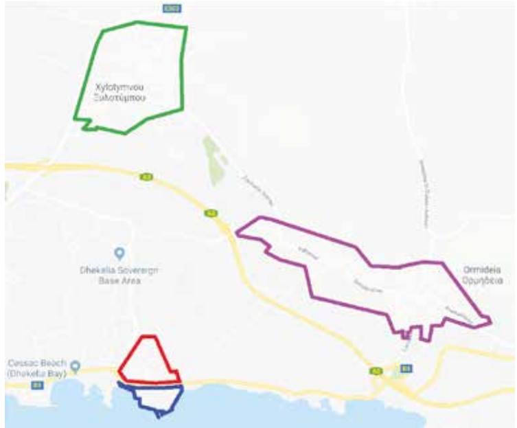
Vier Cypriotische enclaves: Ormidhia (paars), Xylotymbou (groen), Dhekelia elektriciteitscentrale noord (rood) en zuid (blauw). www.google.com

Toen de Britse bases werden opgericht, werden de grenzen zodanig getrokken dat er geen stedelijke gebieden of Cypriotische voorzieningen in kwamen te liggen, maar slechts Britse militaire installaties. Zo ontstonden vier enclaves aan de onderhandelingstafel. In tegenstelling tot de Baarlese enclaves kennen ze dus geen eeuwenlange ontstaanswijze en groei. De vier vernoemde enclaves dateren pas