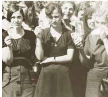
Vijfenvertig jaar later vragen zij nog altijd waar hun geliefden gebleven zijn. www.pappaspost.com

Tussen 1960 en 1973 bereikte Cyprus met zijn vrijemarkt economie – gebaseerd op landbouw en handel – een hogere levensstandaard dan de meeste van zijn burens. Op 15 juli 1974 kwam hieraan een einde met een militaire staatsgreep door de Cypriotische Nationale Garde. Doel was de eenmaking met Griekenland. Vijf dagen later bestormden Turkse soldaten het eiland om de Turks-Cyprioten te helpen. Zij veroverden de noordelijke helft van Cyprus, ongeveer 37% van het totale grondgebied. Alle Turks-Cypriotische bewoners vluchtten daarheen en de Grieks-