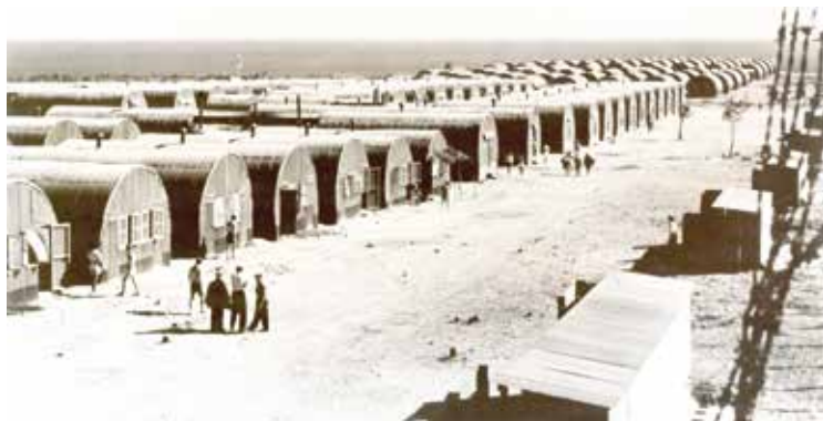
Interneringkamp in Xylotymbou.

In de nasleep van de Tweede Wereldoorlog probeerden duizenden