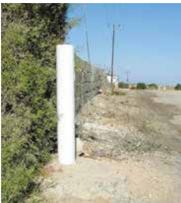
Grenspaal bij de enclavegrens. Links Xylotymbou, rechts Groot-Brittannië.

Ormidhia ligt in een kleine vallei op ruim een kilometer van de zee en is vernoemd naar de vele baaien. Vanuit de enclave is er een gemakkelijke toegang tot het strand en de kleine vissershaven. Aan de kust is men opnieuw officieel op Engels grondgebied. Daar worden veel grote villa's gebouwd. De inwoners leven vooral van de landbouw, veeteelt, visserij en het toerisme. Ormidhia is beroemd voor zijn granaatappels en boomgaarden. De kerk in het centrum van het dorp