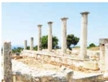
Heiligdom van Apollo in Akrotiri.

nomische stilstand van Noord-Cyprus. Bij aanvaarding van het plan hoopten zij deel te gaan uitmaken van de Europese Unie en de daarmee gepaard gaande economische voordelen te ontvangen. Ook de Turkse premier Erdogan was voorstander van het plan. Hij hoopte hiermee één van de drempels weg te nemen die Turkije verhinderde om lid van de Europese Unie te worden. Maar de Grieks-Cyprioten stemden massaal tegen. In hun ogen speelde het plan-Annan teveel in het voordeel van de Turks-Cypriotische bevolking. Het Britse voorstel om bij goedkeuring van het plan bijna de helft van het grondgebied van hun legerbases terug te geven, deed hen niet van gedachten veranderen.