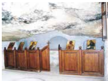
Grotkerk in Xylotymbou. www.xylotymbou-cyprus.com

aardbeving en plunderende barbaarse indringers ten onder ging. In de 12 de en de 14 de eeuw werden kerken gebouwd bij de grotten uit het pre-christelijke tijdperk. Daarna