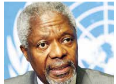
Kofi Annan.

Om conflicten tussen de twee gemeenschappen te voorkomen, werd door de Verenigde Naties van oost naar west over het hele eiland een 180 km lange grensversperring gebouwd. Nog altijd bewaken zo'n 1.100 VN-soldaten deze bufferzone, die op haar breedste punt ruim 7 km bedraagt. In Nicosia, de hoofdstad van beide staten, bedraagt ze amper vier meter. Hier en daar in het niemandsland staan verlaten huizen en lege auto's, alsof de tijd er heeft stilgestaan. Alleen met een geldig paspoort kan je van noord naar zuid (en omgekeerd) reizen.