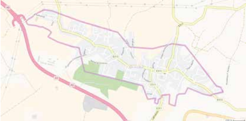
Plattegrond van Ormidhia. www.google.com

nieuwe wegen en woonzones aangelegd. De rijksgrens loopt er zelfs door een paar huizen. Door deze werken zijn tal van grenspaaltjes verdwenen. De enclavegrenzen van Ormidhia zijn hierdoor minder goed gemarkeerd dan die van de drie andere enclaves.