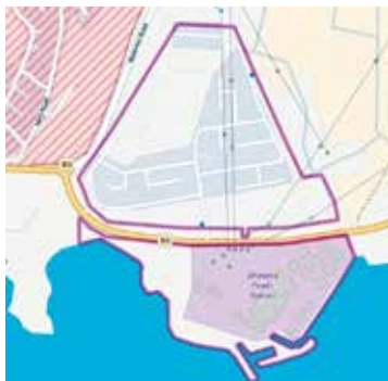
De enclaves Dhekelia elektriciteitscentrale noord en zuid. https://nl.wikiloc.com

Van oorsprong is deze enclave een van de vele nederzettingen voor vluchtelingen, opgericht na juli 1974. De enclave wordt daarom ook EAC Refugee Settlement genoemd. EAC is de afkorting van Electricity Authority of Cyprus . De meeste inwoners zijn afkomstig