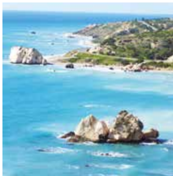
Rots van Aphrodite.

Grieken kwamen vanaf de 4de eeuw voor Christus in Cyprus aan de macht dankzij de veroveringen van Alexander de Grote. Pas eind 16de eeuw kwam daarin verandering. Toen annexeerden Turken het eiland. De Grieken die er woonden, mochten blijven. Maar sindsdien leven Turken en Grieken