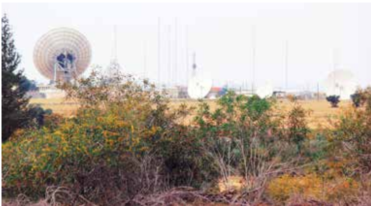
Luisterstation van Agios Nikolaos.

Groot-Brittannië garandeert de uitoefening van controles aan de buitengrens van de legerbasis. Hierdoor kunnen mensen die in de enclaves wonen zich zonder grenscontroles naar de legerbasis begeven en omgekeerd. Heel wat