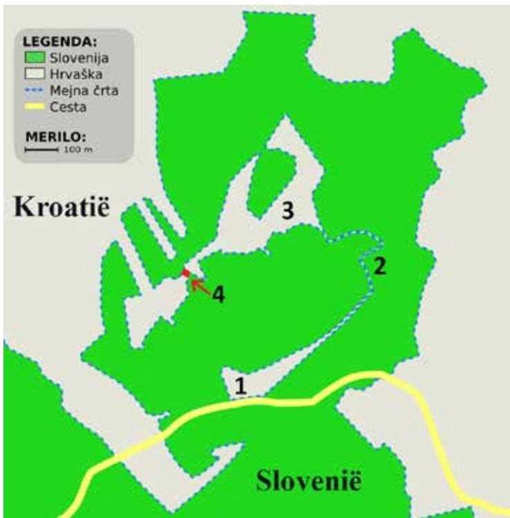
Enclavegebied met de eerste enclave (1), een denkbeeldige navelstreng (2), de tweede enclave (3) en niemandsland (4). https://commons.wikimedia.org

De langwerpige, min of meer driehoekige enclave werd lange tijd niet opgemerkt. Gedetailleerde kaarten deden immers vermoeden dat het gebied door een heel smalle corridor met de rest van Kroatië was verbonden. Deze merkwaardige navelstreng bleek bij nader onderzoek echter uitsluitend te wijten aan de technologische beperkingen van het computerprogramma van het Kroatische kadaster. Dat programma tekent de rijksgrens als een doorlopende lijn. Op die manier liet de computer op de kaart een lijn na die de enclave met de rest van Kroatië verbindt. Hierdoor ontstond een misverstand dat van kaart tot kaart werd herhaald. Google Maps was de eerste kaart die deze fout niet heeft gemaakt.