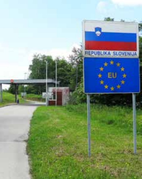
Zicht vanuit Kroatië op de grensovergang in Brezovica.