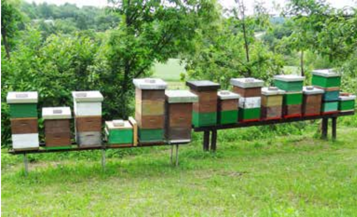
Deze bijen smokkelen nectar van Sloveense bloemen uit de enclave Bž 1 naar Slovenië.