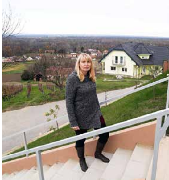
“Ik slaap in een ander land dan mijn man.”