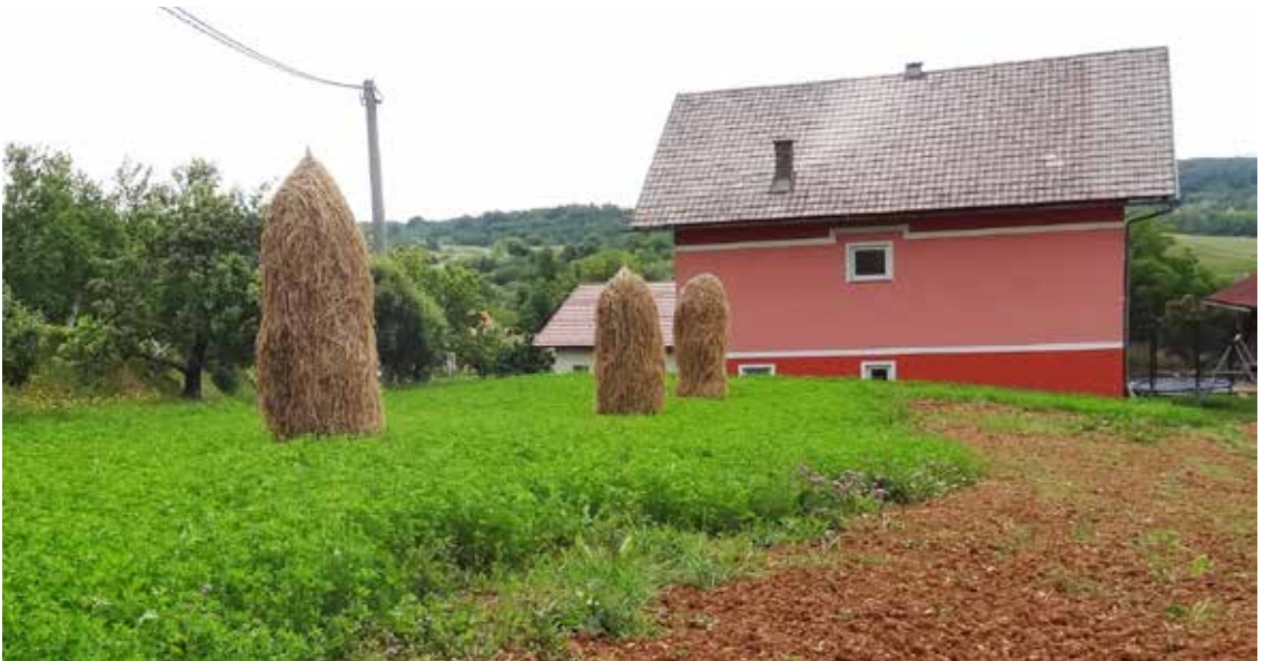
Hooioppers tussen de spurrie in Brezovica pri Metliki.