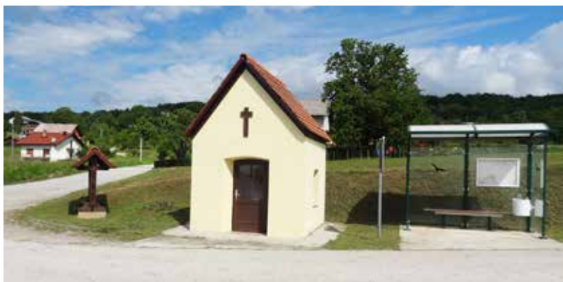
Centraal gelegen kruispunt in de enclave Brezovica žumberačka 1.

Brezovica is één dorp dat zich deels op Sloveens (Brezovica pri Metliki) en deels op Kroatisch (Brezovica žumbera ka) grondgebied bevindt. Tot 1965 telde het vijftien huizen, nu een dertigtal. In 2002 woonden er negenenvijftig mensen. Veel inwoners verhuizen naar de steden. De meeste ingezetenen houden zich voornamelijk met landbouw en handel bezig. In Brezovica zijn veel wijngaarden. De jacht op klein en groot wild tiert er welig en er groeien veel paddestoelen, bosbessen en kastanjes. Een kerk of een school is er niet. Voor hun onderwijs nemen alle kinderen de bus naar Suhor in Slovenië.