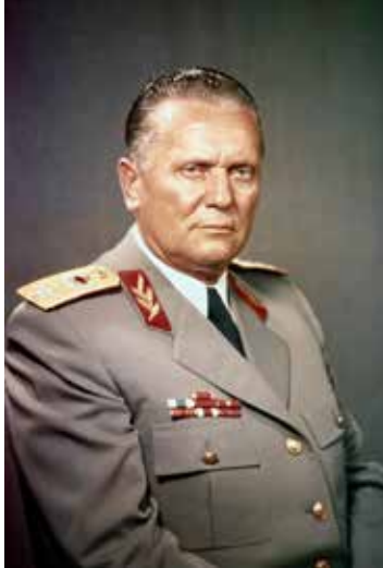
Josip Broz, bijgenaamd Tito (1892-1980).

Na de overwinning van de communistische partizanen van Tito tijdens de Tweede Wereldoorlog kwam in Joegoslavië een communistisch regime aan de macht, waarvan Slovenië een deelrepubliek was. Maarschalk Tito slaagde door onderdrukking van het nationalisme erin om alle volkeren van Joegoslavië bijeen te houden. Toen hij in 1980 overleed, kende het nationalisme een heropleving en begonnen zowel Slovenië als Kroatië meer autonomie na te streven. Op 25 juni 1991 verklaarden beide landen zich onafhankelijk. Het federale leger van Joegoslavië