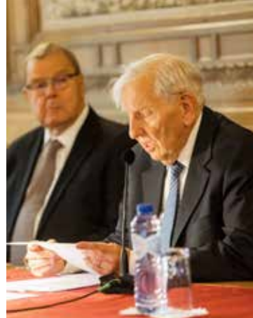
Voorlezing van het arrest door het Hof van Arbitrage in Den Haag.

Tot voor kort omsloten Slovenië en niemandsland gezamenlijk een grillig stukje Kroatische grond. Dat was geen echte enclave omdat het gebied niet omsloten was door één ander land, maar door twee. De Sloveense opeising van niemandsland op 21 mei 2015 bracht hierin verandering en had niet alleen gevolgen voor Slovenië zelf (dat een heel klein beetje groter werd) en voor het koninkrijk Enclava (dat moest verhuizen). Ook voor Kroatië veranderde er iets. Laatstgenoemd land kreeg op dat moment de facto een tweede enclave erbij. De jure (van rechtswege) was het nog wachten tot de beslissing van het Permanente Hof van Arbitrage op 29 juni 2017. Toen werd ‘Brezo-