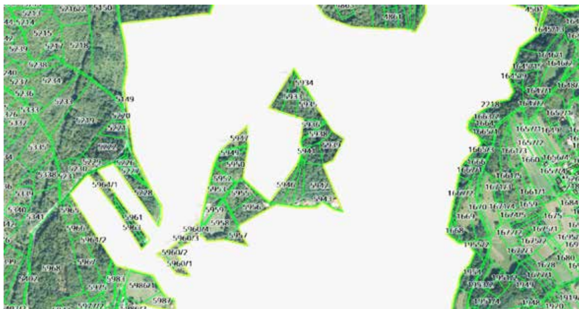
Enclave BŽ 2 in het Kroatische kadaster.