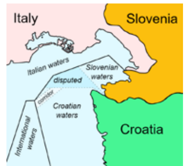
Betwiste maritieme grenzen in de baai van Piran.

Kroatië wordt begrensd door Slovenië, Hongarije, Servië, Bosnië en Herzegovina, Montenegro en de Adriatische zee, waarin meer dan duizend Kroatische eilanden liggen. Het land is bijna anderhalve keer zo groot als Nederland en telt zo'n 4,3 miljoen inwoners.