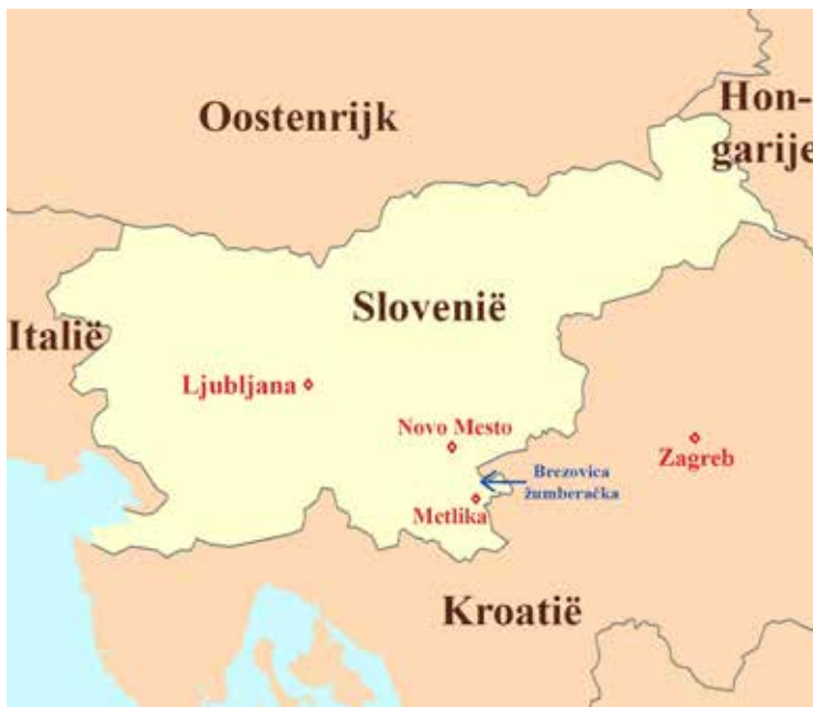
Brezovica žumberačka, Kroatisch enclavegebied in Slovenië.