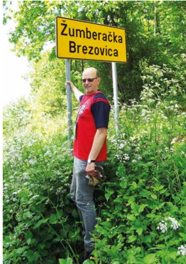
Aan de grens tussen Slovenië en Kroatië.