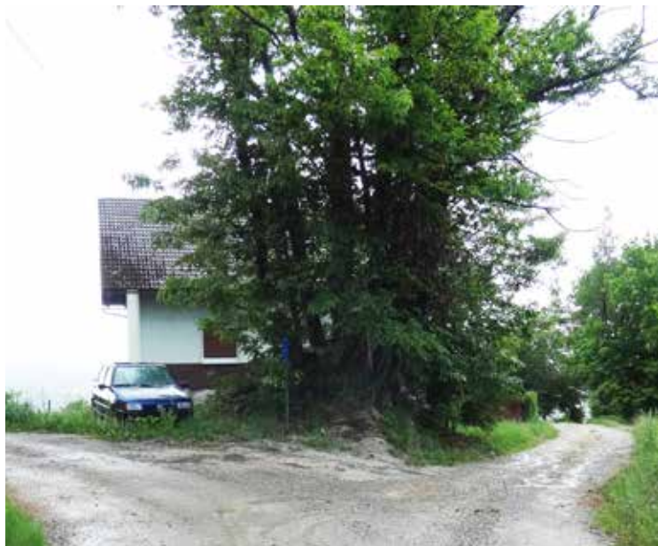
Woonhuis in de enclave Bž 2.

De enclave Bž 2 heeft een uitgesproken grillige vorm. De oppervlakte bedraagt ruim 48.000 m 2 , de omtrek ongeveer 2.140 meter. De dichtste afstand naar het Kroatische vasteland bedraagt slechts vijftien en een halve meter. De enclave is bewoond. Er staan twee huizen.