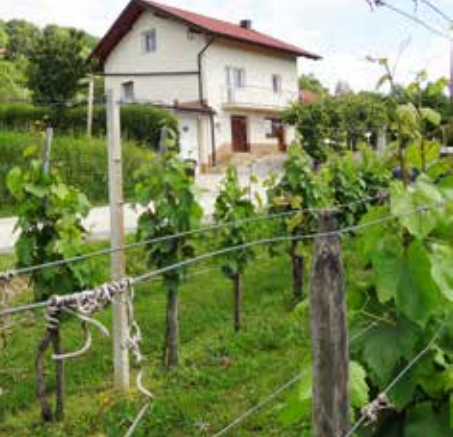
Woonhuis in de enclave Bž 1, met wijngaard in Slovenië.