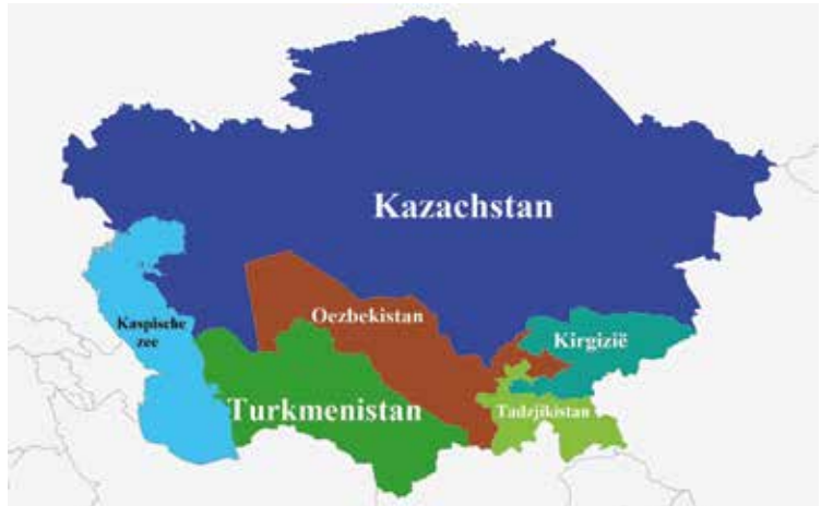
Landen van Centraal-Azië. www.topomania.net

Centraal-Azië telt 61 miljoen inwoners en bevindt zich te midden van vier Euraziatische grootmachten: in het noorden ligt Rusland, in het oosten China, in het zuiden Indië en in het westen de Europese Unie. De regio heeft een gemeenschappelijke cultuurhistorische en geografische identiteit. Maar toch zijn er grote economische verschillen. Kazachstan en Turkmenistan hebben veel olie- en gasreserves. Kirgizië en Tadzjikistan zijn slechts