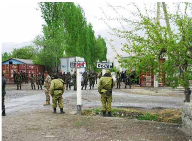
Enclavegrens tussen Vorukh en Aksai in 2008.

Tadzjikistan heeft nog een derde enclave: Sarvan (Sarvak, Sarvaksof of Sarvaki-bolo). Die enclave ligt in tegenstelling tot de twee vorige niet in Kirgizië maar in Oezbekistan. De kortste afstand naar het thuisland bedraagt 1,4 km. De oppervlakte van de lange, smalle vallei bedraagt 7 tot 8 km 2 . In de enclave wonen 150 à 200 mensen en zij leven van de landbouw en de katoenteelt. Het enige dorp, Sarvan, is in twee gelijke stukken verdeeld. Inwoners van de ene dorpsheft wonen in Oezbekistan, de anderen in de Tadzjiekse enclave. De ene helft van de bevolking heeft een Oezbeeks paspoort, de andere een Tadzjiekse. Nochtans zijn alle inwoners van Sarvan van Oezbeekse origine. Iedereen voelt zich Oezbeek. Toen een Tadzjiekse diplomaat de plaatselijke basisschool bezocht, vroeg hij of de leerlingen de naam van hun president kenden. "Islom Karimov," was het unanieme antwoord. "Fout," zei de diplomaat. "Emomali Rakhmonov is onze president. Proberen we het nog eens? Wie is onze president?" En opnieuw luidde het antwoord eensgezind: "Islom Karimov".