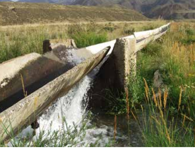
Sovjet-irrigatie is aan vernieuwing toe. www.cawa-project.net

overwicht van de nomadische ruitervolken eindigde pas toen de dorpsbewoners de beschikking over vuurwapens kregen. Intussen breidde het Russische Rijk zijn invloed uit en tegen het einde van de 19de eeuw was Centraal-Azië in Russische handen. De inmenging was eerst minimaal. Inheemse cultuur, levensstijl en bestuursstructuren werden ongemoeid gelaten. Maar na de Russische Revolutie werden de Centraal-Aziatische gebieden tot onderdeel van