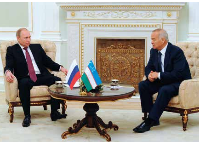
De presidenten Poetin (Rusland) en Karimov (Oezbekistan).

De grenzen tussen de Centraal-Aziatische Sovjetrepublieken waren niet gebaseerd op de etnische samenstelling van de bevolking. Stalin paste in de jaren dertig van de vorige eeuw de verdeel-en-heerstactiek toe. Gevreesd werd immers dat de moslimvolken zich zouden verenigen tegen het communisme. Door het gebied te versnipperen, kon dit gevaar worden bedwongen. De grenzen waren destijds overigens minder belangrijk omdat de verschillende republieken in de gezamenlijke Sovjet-Unie opgingen. Na het uiteenvallen van het Sovjetrijk in 1991 riepen de vijf republieken van Centraal-Azië elk hun onafhankelijkheid uit en werden die interne grenzen plots rijksgrenzen. Op dat moment ontstonden maar liefst vijftien enclaves: zeven in Oost-Europa en acht in de Ferghana Vallei in Centraal-Azië. De voormalige bestuurders van de communistische partij behielden hun macht en besturen de regio op zeer autoritaire wijze.