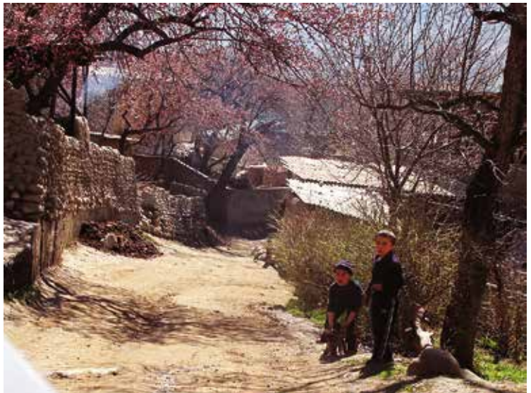
Wat brengt de toekomst voor deze kinderen in Vorukh?