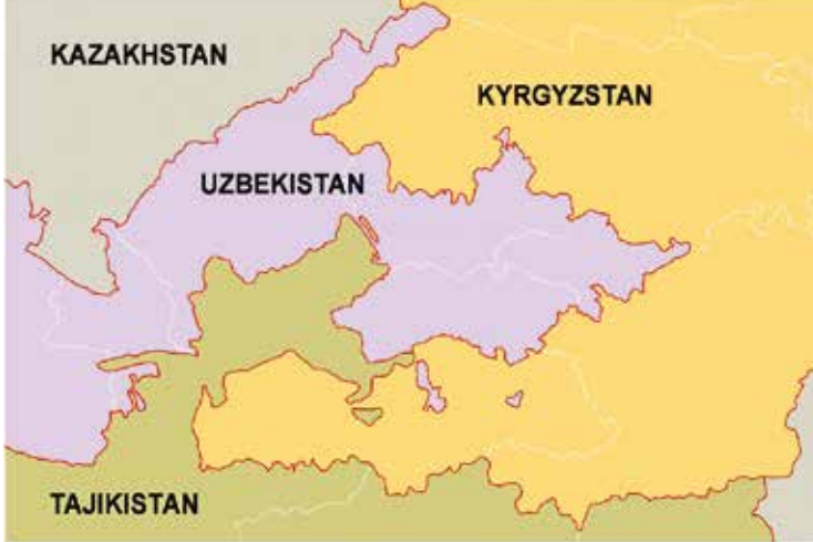
Grillige, vaak niet-erkende staatsgrenzen. https://jamestown.org

nog communautaire rellen bij in het zuiden van land. Bij geweld tussen jonge, geradicaliseerde Kirgiezen en Oezbeken vielen toen zeker vierhonderd doden.