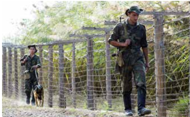
Tadzjikse soldaten bewaken de grens met Oezbekistan.