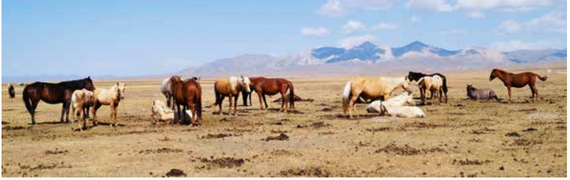
Paarden van nomaden wachten op hun melkbeurt.