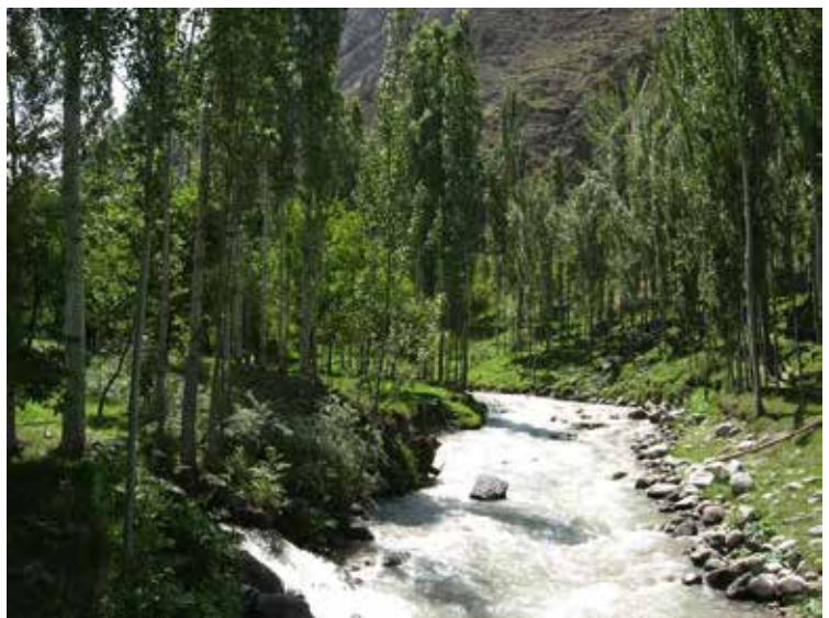
Karavshin rivier in Vorukh.