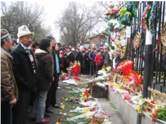
Tulip Revolution in 2005. www.neweurasia.net

Zowat 70% van de inwoners is Kirgizisch van oorsprong, bijna 15% Oezbeeks en ongeveer 6% Russisch. Bijna 40% van de bevolking leeft onder de armoedegrens. Ook behoort Kirgizië tot het selecte clubje van de twintig meest corrupte landen ter wereld. De voorbije jaren waren turbulent op politiek gebied. In 2005 en in 2010 waren er volksopstanden die de president naar huis stuurden. Daar kwamen