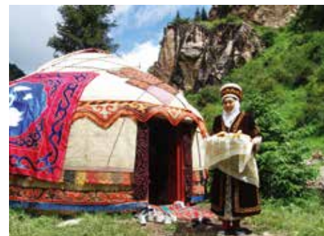
Nomade in Kirgizië.

De relatie tussen dorpsbewoners en steppenomaden was eeuwenlang problematisch. Het militaire