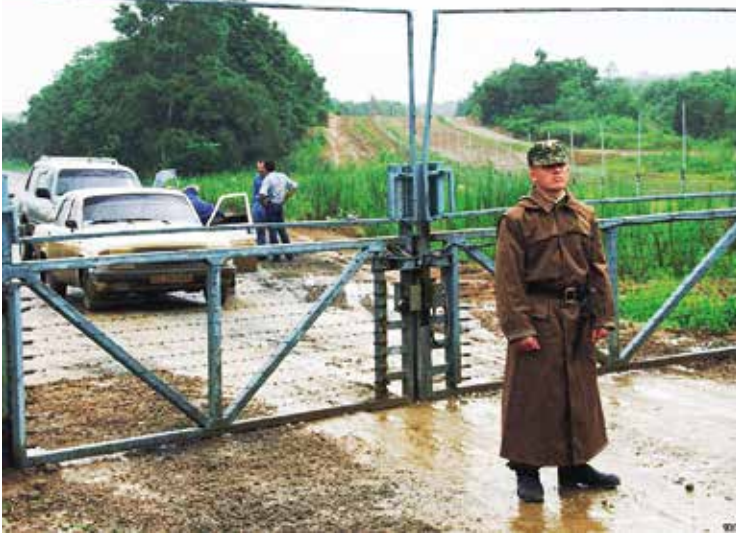
Gesloten enclavegrens in Vorukh.

als het omringende land slecht is. Financiële verarming, verminderde middelen, slabakkende werkaanbiedingen en een snelle bevolkingsgroei veroorzaken angst voor de toekomst. Enclavebewoners zoeken dan betere omstandigheden in het buurland, waardoor de greep van dat buurland op de enclave alsmaar toeneemt.