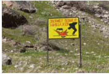
Opgepast voor landmijnen. https://joshikwashere.blogspot.be

Die enclaves zouden geen probleem zijn, mochten de drie landen wat beter met elkaar kunnen opschieten. Na zesentwintig jaar onafhankelijkheid zijn sommige grenzen nog niet definitief getrokken en maken meerdere landen aanspraak op eenzelfde gebied. Dat leidt tot problemen voor het personen- en goederenverkeer. Geregeld worden grenzen gesloten zodat enclavebewoners hun dorpen niet kunnen verlaten of hun thuis-