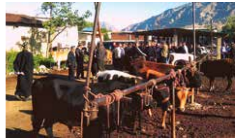
Veemarkt in Vorukh. http://joshikwashere.blogspot.be

Vorukh (of Voroech) is de grootste Tadzjiekse enclave in Kirgizië. Zij bevindt zich op de rechteroever van de Karavshin rivier. De enige weg