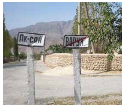
Enclavegrens tussen Vorukh en Aksai in 2013.

Een maand later werden twee Tadzjiekse mannen door Kirgizische grenswachten opgepakt omdat zij illegaal de grens passeerden om brandhout te verzamelen. Ze slaagden telefonisch erin om hun dorpsgenoten te verwittigen, waarna deze bij de grenspost verzamelden en drie Kirgiziërs sloegen. Daarop kwamen inwoners uit Kirgizië naar de grenspost en werd de doorgangde weg uit veiligheidsoverwegingen tijdelijk afgesloten.