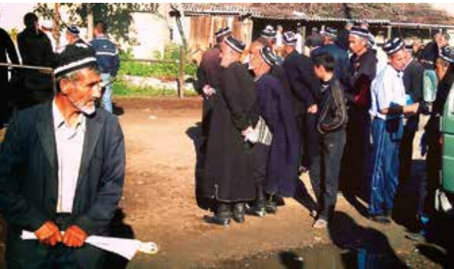
De markt, een mannenaangelegenheid. Let op de typische hoofddekseis.

Meestal zijn ze genoemd naar één of meerdere van de dorpen in de enclave, soms zelfs naar een nabijgelegen dorp. Kirgizië, het omringende land, erkent dat Vorukh Tadzjiekse grondgebied is, maar beide landen discussiëren over de exacte rijksgrenzen. Onderstaand cijfermateriaal toont dat door beide landen zeer uiteenlopende gegevens worden verstrekt. Vorukh zou een oppervlakte hebben van 96,7 tot 130 km 2 . De enclave ligt op 5,3 à 20 km van de grens met het thuisland. Het aantal inwoners wordt geschat op 29.000 à 40.000, verspreid over zeventien dorpen. Over één ding is men het eens: maar liefst 95% van de bevolking is Tadzjiekse, de resterende 5% is Kirgizisch.