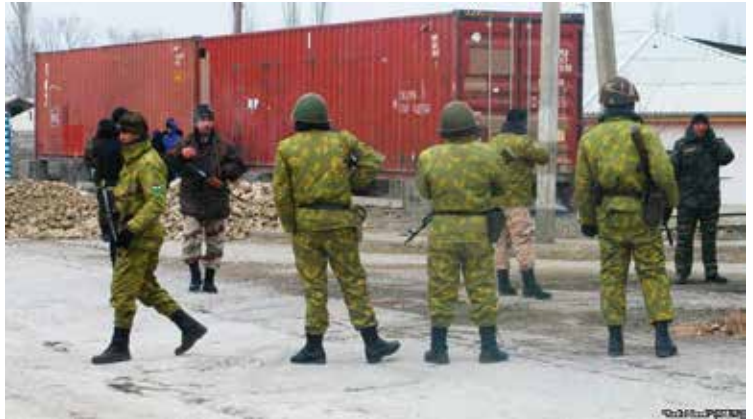
Tadzjiekse en Kirgizische grenswachters bij een checkpoint in en uit Vorukh. www.rferl.org

Neen, in vergelijking met Centraal-Azië is de situatie in de Baarlese enclaves niet problematisch. Onze belangrijkste troef? Na eeuwen-