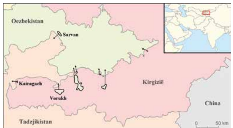
Centraal-Azië telt acht enclaves, waarvan drie Tadzjiekse. https://warontherocks.com

armoedegrens, al is de bodem rijk aan grondstoffen. De in september 2016 overleden president Islam Karimov hield het land in een stevige greep. Oppositieleiders worden gearresteerd en opgesloten, of ze verkiezen zelf een verblijf in het buitenland. Vooral de militante islam wordt stevig onderdrukt. Ook een liberalisering of het invoeren van de democratie wordt op een repressieve wijze en ten koste van godsdienstvrijheid en burgerrechten verhinderd. Radicale Islamisten beweren dat meer dan de helft van de jongeren tot 35 jaar de invoering van de Sharia-wetten wil. In 1998 en 1999 trokken grote groepen extremisten van de 'Islamic Movement of Uzbekistan' (IMU) via Tadzjikistan en Kirgizië naar Oezbekistan. Deze organisatie wou de grensregio veroveren om er een aantal basissen op te richten. Na een drie maanden durende oorlog in 1999 werd de poging verijdeld. Sindsdien wordt vooral de grens met Tadzjikistan zwaar door militairen bewaakt. De IMU pleegt nog altijd terroristische aanslagen en zorgt regelmatig voor gijzelingen en schietpartijen. Sinds een aantal jaren is in het grensgebied ook een Kirgizische beweging