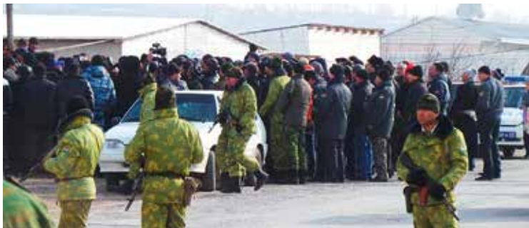
Oproerpolitie aan de grens met Vorukh.

Niet zover ten oosten van het Kirgizische dorp Kairagach (of