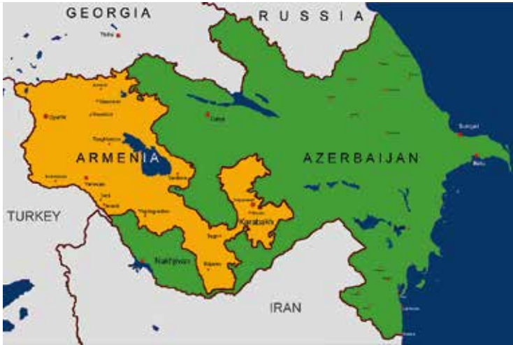
Armenië is bereid om zijn leger terug te trekken uit het gebied rond Nagorno-Karabach op voorwaarde dat er een corridor komt. https://patrickmontreal.deviantart.com

meer naar huis zullen gaan. Aan de presidents- en parlementsverkiezingen mogen ze wel deelnemen.