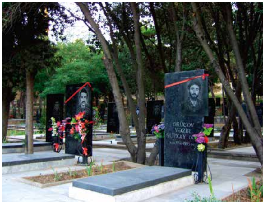
Grafstenen van gesneuvelde Azerbeidzjaanse soldaten.

In 2014, twee decennia na hun gedwongen verhuis, mochten de vroegere bewoners van de Azerbeidzjaanse enclaves niet stemmen bij de gemeenteraadsverkiezingen in hun land. Zij verwierven in hun nieuwe woonplaats geen permanente verblijfsstatus omdat zij nog altijd in hun enclavedorp geregistreerd staan en niet in het gemeentelijke kiesdistrict waar ze nu wonen. Ambtenaren beweren dat de ontheemden maar tijdelijk uit hun enclave weg zijn. De terughoudendheid om hen hetzelfde stemrecht te geven als de andere inwoners, komt voort uit de angst dat dit gezien kan worden als een de facto erkenning dat ze nooit