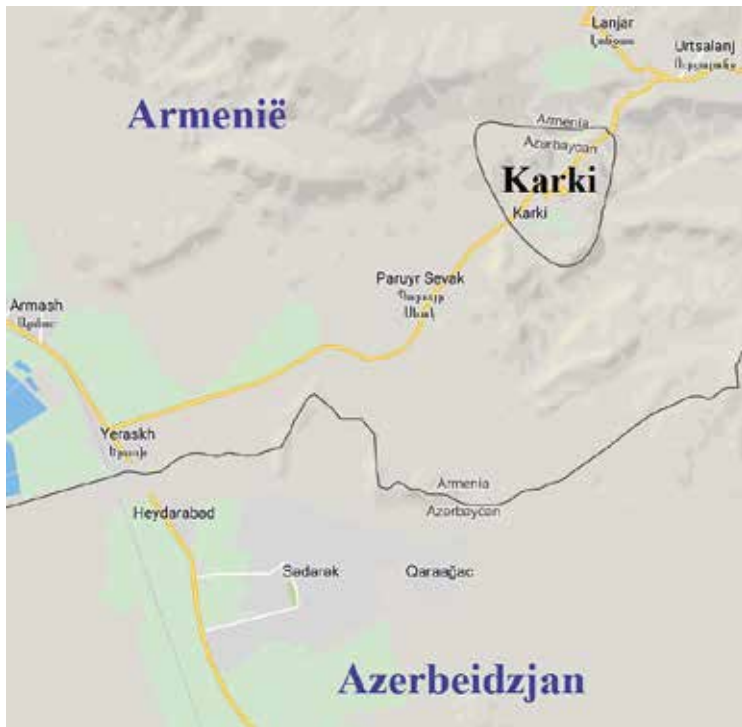
Karki, een enclave van de Azerbeidzjaanse autonome republiek Nachitsjevan. https://www.google.be/maps

Yaradullu-noord bevindt zich op het dichtste punt op vijftig meter van de rijksgrens, Yaradullu-zuid op tweehonderd meter. De oppervlakte van Yaradullu-noord bedraagt 12,29 hectare (450 x 273m), die van Yaradullu-zuid 3,50 hectare (200 x 175m). Beide enclaves zijn als graanakker in gebruik. Google maps toont deze percelen niet als enclaves! Sinds de Nagorno-Karabachoorlog in mei 1992 heeft het leger van Armenië deze twee gebieden bezet. De internationale gemeenschap erkent de bezetting niet, zodat ze wettelijk