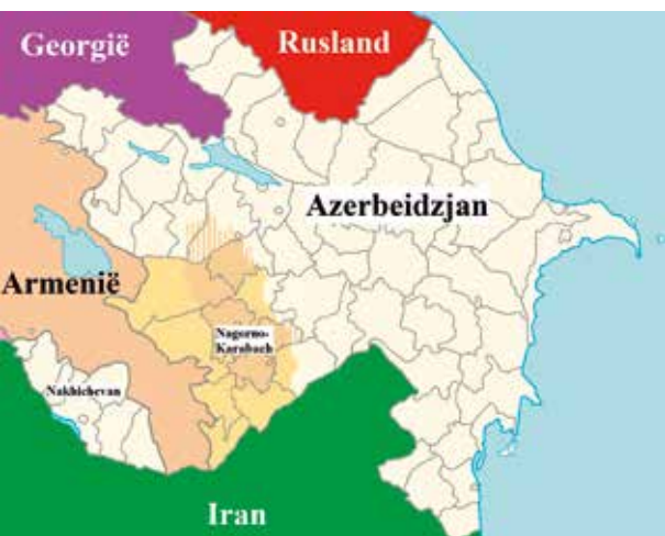
Het door Armenië op Azerbeidzjan veroverde gebied is geel ingekleurd. https://commons.wikimedia.org

Sinds de oudheid bevindt de Kaukasus zich op het kruispunt van de grote mogendheden. De grenzen veranderden voortdurend, afhankelijk van militaire successen of mislukkingen. Armenië is in zijn geschiedenis vaak geannexeerd, o.a. door Perzen, Arabieren, Turken en Mongolen. Duizenden jaren lang werd de bevolking uitgemoord en het grondgebied door grootmachten geclaimd. In 1915 vond de Armeense genocide plaats.