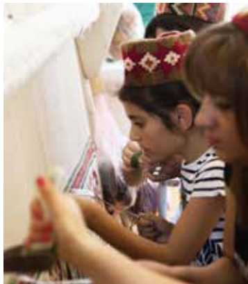
Artsvashen is bekend voor zijn tapijtweverijen. http://www.osce.org

In 1920 vergat het Rode Leger om Artsvashen te veroveren. Pas na onderhandelingen namen Sovjet-