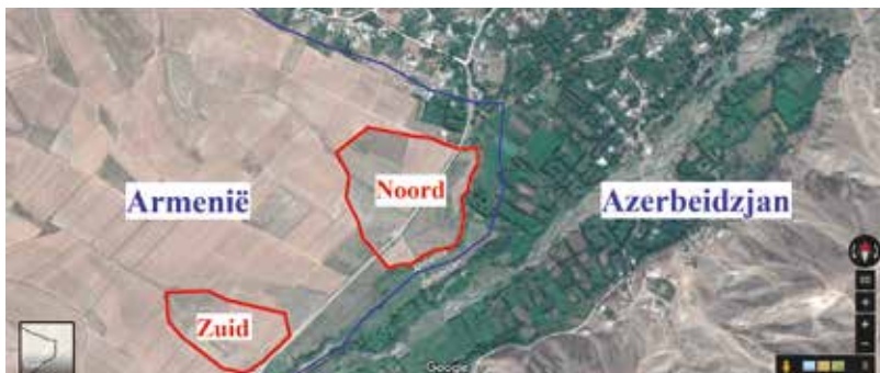
De twee enclaves van Yaradullu. https://www.google.be/maps

gebleven. Het zijn restanten van twee verwoeste en geplunderde dorpen. Koeien en schapen grazen tussen dakloze ruïnes. De puinhopen maken beschamend duidelijk hoe snel een welvarend dorp in een archeologische site kan veranderen. Het is niet geheel duidelijk wanneer de verwoestingen zijn aangericht, in 1990 of 1992. Azerbeidzjan en Armenië vertellen immers een van elkaar verschillend oorlogsverhaal. Zo proberen zij de schuld bij de tegenpartij te leggen. Vast staat echter dat beide landen verantwoordelijk zijn voor het oorlogsgeweld dat o.a. tot dertigduizend doden en een miljoen ontheemden heeft geleid. Alle inwoners van de enclave Yukhari Askipara zijn uit hun huizen verjaagd nadat het Armeense leger er een kanonpost in beslag nam. Het grondgebied is bij de Armeense provincie Tavush gevoegd.