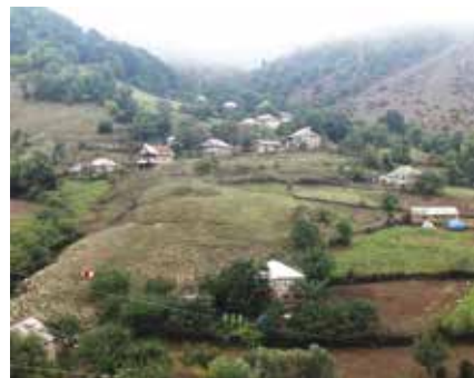
Artsvashen betekent letterlijk 'adelaarstad'. https://mapsights.com

Naast de vijf Azerbeidzjaanse enclaves in Armenië is er ook één Armeense enclave in Azerbeidzjan, namelijk Artsvashen. De oorspronkelijke dorpsnaam Bashkend (Azerbeidzjan noemt die enclave nog altijd zo) werd later in Hin ('Oud') Bashkend veranderd om het dorp te onderscheiden van Nor ('Nieuw') Bashkend, een dorp ge-