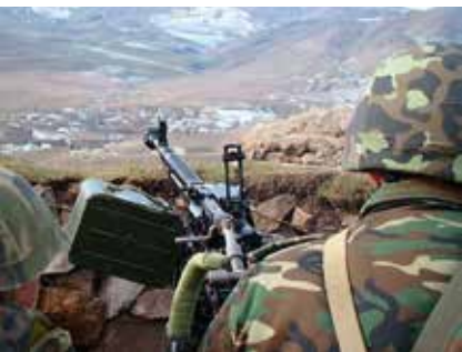
Gewapende militairen maken deel uit van het dagelijks leven.

partij, grijpt dit als een excuus aan om het geweld voort te zetten. Het wankele bestand wordt regelmatig geschonden, vooral in het noordoosten van Armenië. Die schendingen vallen vaak samen met interne aangelegenheden zoals verkiezingen, protesten of hoog politiek bezoek. Europa kijkt bang toe omdat een destabilisatie van de regio de aanvoer van olie en gas uit de Kaspische Zee bedreigt. De belangrijkste oliepijplijn van Azerbeidzjan loopt op minder dan 45 km van het conflictgebied.