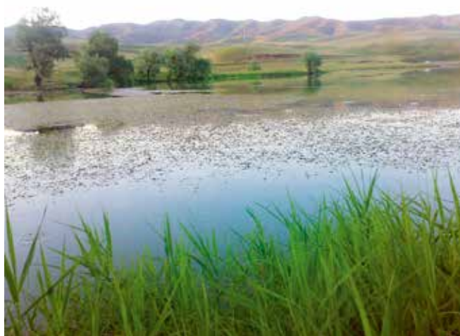
Het Bashkend-meer dient als waterreservoir. http://www.panoramio.com

In de Sovjettijd was een tak van het Armeense staatstapijtbedrijf Haygorg in Artsvashen gevestigd. Vrouwen leerden het weven van hun moeders en grootmoeders, die decennialang voor Haygorg hadden gewerkt. Het was een schande wanneer een meisje of vrouw in Artsvashen geen tapijten kon weven. Wie niet voor Haygorg werkte, had thuis een eigen weefgetouw. Emigrerende vrouwen uit Artsvashen hebben in hun nieuwe woonplaatsen de traditie van het tapijten weven voortgezet. In 1945 regelden de inwoners het transport van irrigatiewater naar hun dorp. Met 500 hectare landbouwgronden is Artsvashen een overwegend agrarisch gebied. Met de uitbreiding van het dorp werd alsmaar meer water naar het dorp geleid. In 1968 werd een eigen waterreservoir aangelegd. Door mijnbouw is de enclave ook rijk aan grondstoffen, inclusief goud.