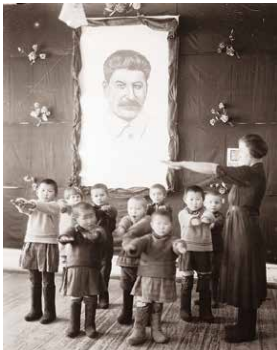
Stalin was destijds alom aanwezig. http://www.banman.am

Vladimir Lenin en zijn opvolger, Josef Stalin, hebben de afbakening van de grenzen in de regio toegevoegd aan het Kaukasische bureau van de Russische communistische partij. Stalin speelde graag met de interne grenzen van de Sovjet-Unie. Ze werden meermaals hertekend, maar geen van de partijen was ooit volledig met de resultaten tevreden. Als gevolg van Stalins 'verdeel en heers'-beleid erfden Azerbeidzjan en Armenië tal van grensproblemen. Onder andere