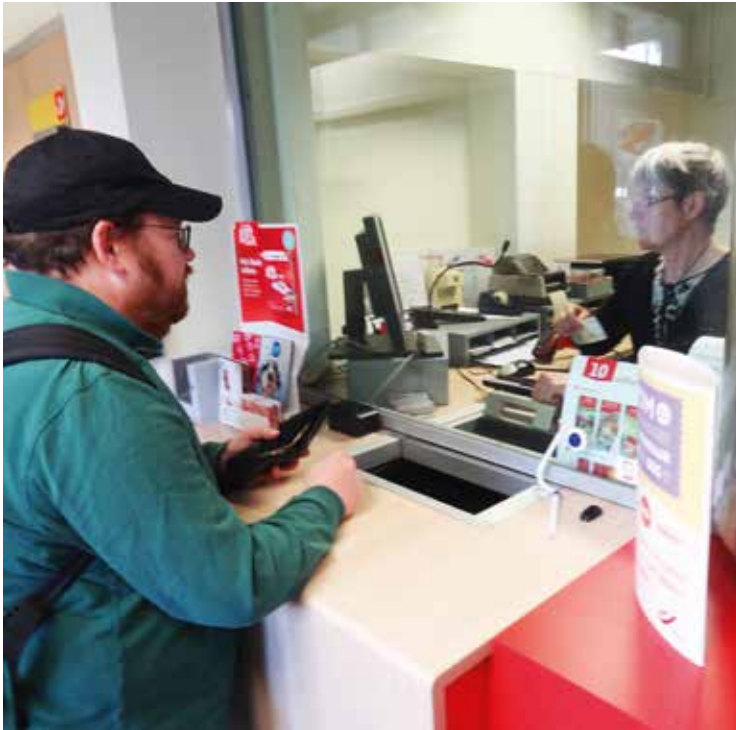
Aankoop van een postzegel in het postkantoor van Baarle-Hertog.