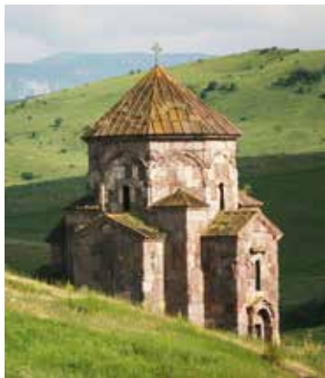
De Albanese tempel in Yukhari Askipara dateert uit de vijfde tot de achtste eeuw. https://nl.wikipedia.org

Vier Azerbeidzjaanse enclaves bevinden zich in het noordoosten van Armenië. Yukhari Aski-