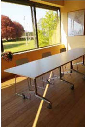
In het gemeentehuis van Baarle-Hertog duidt ledverlichting op de grond de grens aan.

"Many visitors to the town take advantage of crossing the border. I admit having seen similar issues in the US, where it was cheaper to go clothes shopping in another state, but crossing country lines takes that to a new level. It's not only an issue of shopping, but also of different traffic and other laws. And the rule of the front door led to some interesting situations, such as when a border needs not only latitude and longitude, but also elevation! When I worked for