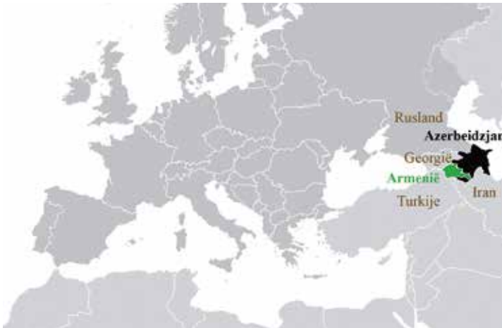
Armenië (groen) en Azerbeidzjan (zwart) liggen in de Kaukasus bergregio. https://en.wikipedia.org

De zoektocht naar enclaves voert ons ditmaal naar het grensgebied van Azerbeidzjan en Armenië in Oost-Europa. In de vorige afleveringen bezochten wij onder andere negen enclaves die hun oorsprong vonden in het uiteenvallen van de Sovjet-Unie eind 1991: drie van Tadzjikistan (Vorukh, Kairagach en Sarvan), vier van Oezbekistan (Sokh, Qalacha, Shakhimardan en Dzhangail), één enclave van Kirgizië (Barak) en één van Rusland (Sankovo-Medvezhye). Daar voegen we nu zes enclaves aan toe: vijf enclaves van Azerbeidzjan (Yukhari Askipara, Barkhudarli, Yaradullu-noord, Yaradullu-zuid en Karki) en één van Armenië (Artsvashen). Dit betekent dat de opheffing van de Sovjet-Unie minstens vijftien enclaves heeft voortgebracht! Veertien ervan hebben grenzen die onderling betwist worden. Dat geldt namelijk ook voor de enclaves van Azerbeidzjan en Armenië, twee oorlogvoerende landen. Alleen de Russische enclave in Wit-Rusland is niet omstreden, maar die is onbewoonbaar door de nucleaire straling.