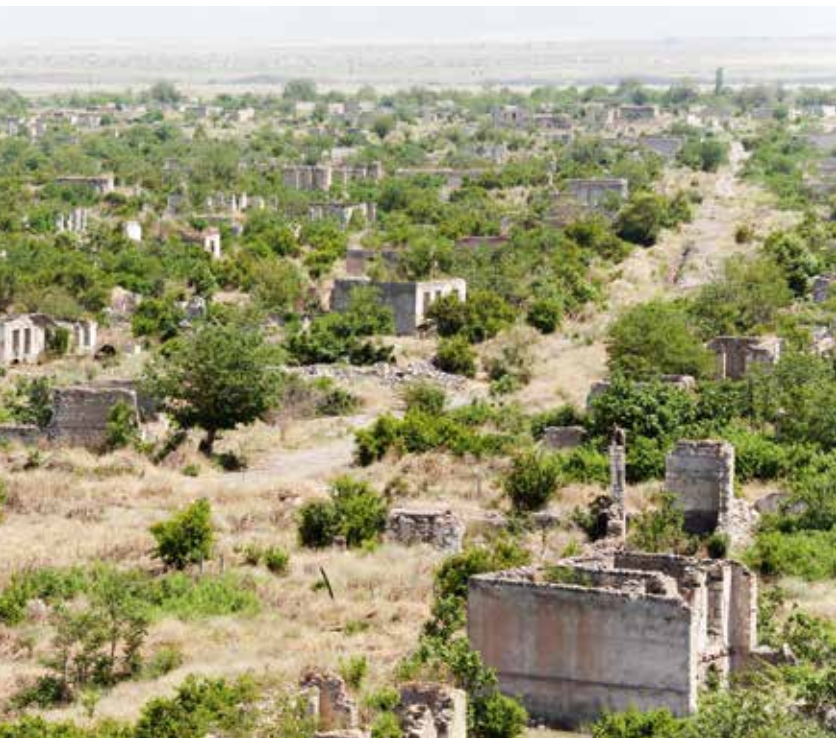
Ruïnes in de grensregio. https://commons.wikimedia.org

'Yaradullu-noord' en 'Yaradullu-zuid' zijn twee kleine, onbewoonde Azerbeidzjaanse enclaves, volledig