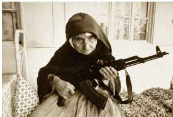
Een 106-jarige Armeense vrouw verdedigt haar woning. https://www.reddit.com