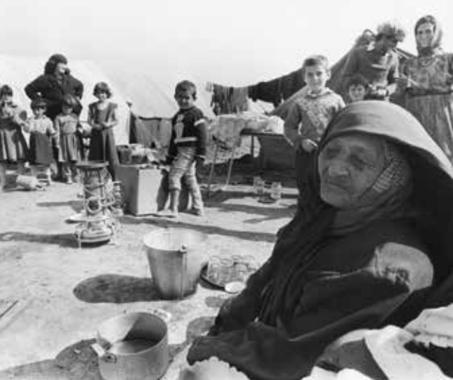
Azerbeidzjaanse vluchtelingen tijdens de Nagorno-Karabach oorlog.