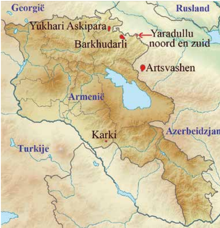
Vijf enclaves van Azerbeidzjan en één van Armenië.

grote etnisch Armeense regio's als Nagorno-Karabach en Nakhichevan waren door Stalin aan Azerbeidzjan geschonken. Deze abnormaliteiten maakten de scheiding beginjaren negentig tot een ware nachtmerrie. Daarnaast legde Stalin de basis voor het ontstaan van zes enclaves in de regio: vijf Azerbeidzjaanse en één Armeense.