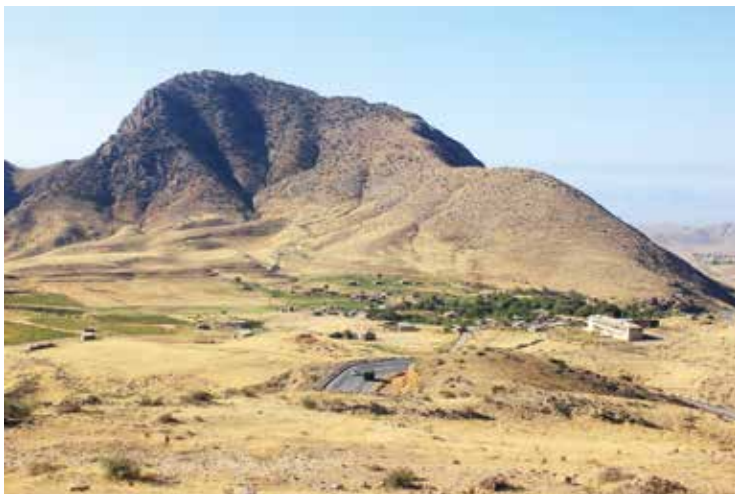
Karki, gezien vanop de Armeense noord-zuid snelweg. https://nl.wikipedia.org

nog een vijfde Azerbeidzjaanse enclave in het zuidwesten van Armenië. 'Karki' is een enclave van de Azerbeidzjaanse autonome republiek Nakhichevan en ligt ongeveer 3,85 kilometer ten noorden ervan. Heel de enclave is ongeveer 1.900 hectare groot. Karki behoort tot het Sadarak-district en wordt geheel omgeven door de Armeense provincie Ararat. De hoofdweg van Yerevan naar Meghri, die het noorden van Armenië met het zuiden ervan verbindt, loopt door de enclave. Het dorp Karki telt 2.260 inwoners en hoort officieel bij de gemeente Heyderabad in Nakhichevan. Karki ligt aan de oever van de Arpaçay rivier en aan de voet van een hoge berg. Het is een groen dorp, omringd door droge weilanden en gelegen aan de rand van het Khosrov natuurreservaat. Er is een geweldig uitzicht op de