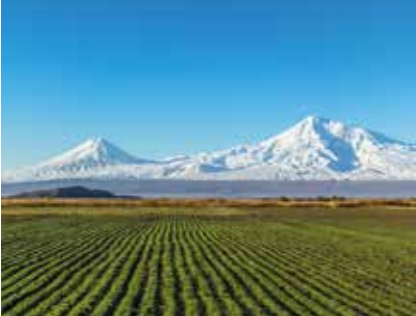
De berg Ararat in Armenië. https://nl.wikipedia.org

is Armenië lid van de Raad van Europa. De geschiedenis van Armenië, een van de oudste landen ter wereld, gaat tot ongeveer 1500 v.C. terug. Het land strekte zich uit van de Middellandse tot de Kaspische Zee. Geografisch is het nu nog slechts een deeltje van weleer.