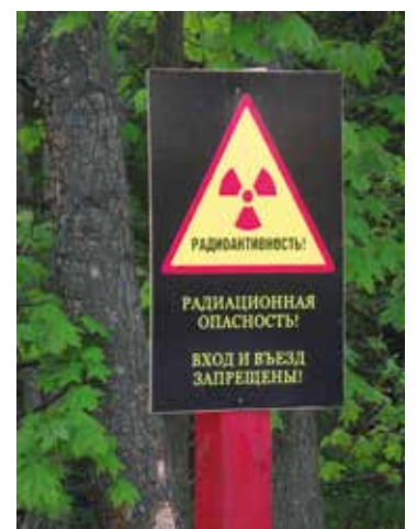
09. Straling is onzichtbaar. http://mapio.net