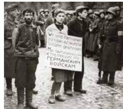
Wit-Russische partizanen, kort voor hun terechtstelling.