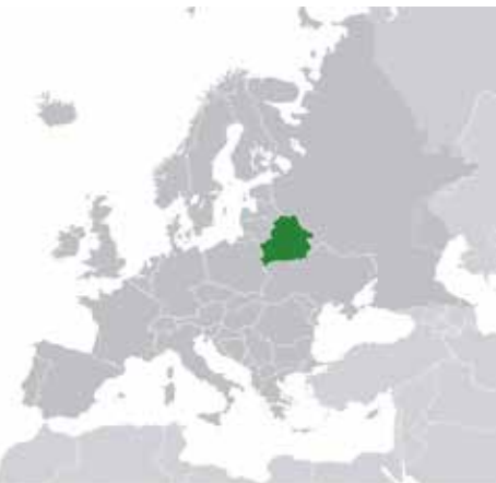
Wit-Rusland, officieel de Republiek Belarus. www.actualitix.com

Op onze denkbeeldige, jarenlange ontdekkingsreis naar alle enclaves van onze planeet verlaten we Azië en zetten we koers naar Oost-Europa. Ook daar ontstonden na het uiteenvallen van de Sovjet-Unie in 1991 tal van enclaves. We 'bezoeken' in deze aflevering een Russische enclave en voor één keer ben ik écht blij dat het slechts een denkbeeldige reis is! De ware reden verneem je verderop in de tekst.