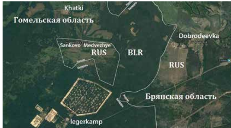
Sankovo-Medvezhye en omgeving. http://belarusiya.com

Na de oorlog werden de dorpen heropgebouwd. Sankovo en Medvezhye telden samen ongeveer 500 inwoners. Moerassen werden gezamenlijk drooggelegd en de oogsten waren goed. De dorpen werden welvarend: de straatverlichting scheen helder en het licht van de tv-schermen flikkerde