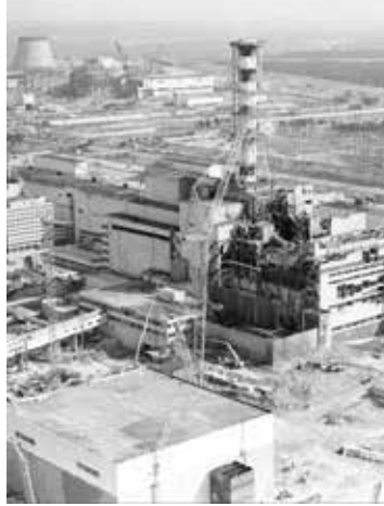
Luchtfoto van de ontplofte reactor (1986).

In de ochtend van 26 april 1986 sloeg het noodlot toe: na een mislukte veiligheidstest in de koelinstallatie volgden twee ontploffingen in reactor vier van de kerncentrale in Tsjernobyl (Oekraïne). Die waren zo hevig dat het dak van de reactor werd weggeblazen. Dat onderdeel woog nochtans meer dan duizend ton. De explosies veroorzaakten de grootste kernramp in de geschiedenis. Terwijl de reactor twee weken in brand stond, kwam de grootste hoeveelheid radioactief materiaal ooit in de atmosfeer terecht. Die straling bereikte 42% van het Europese grondgebied. Het duurde maar liefst achttien dagen vooral