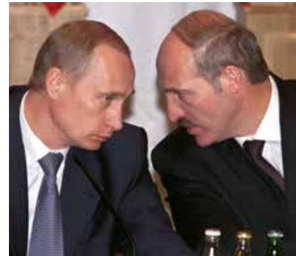
Vladimir Poetin en Aleksandr Loekasjenko in 2015.

Poetin voelde er weinig voor om Rusland ondergeschikt te maken aan de unie en wilde zijn eigen beleid voeren, zonder bemoeienis van buitenaf. Daarbij kwam een gasconflict de relatie tussen beide landen ernstig vertroebelen.