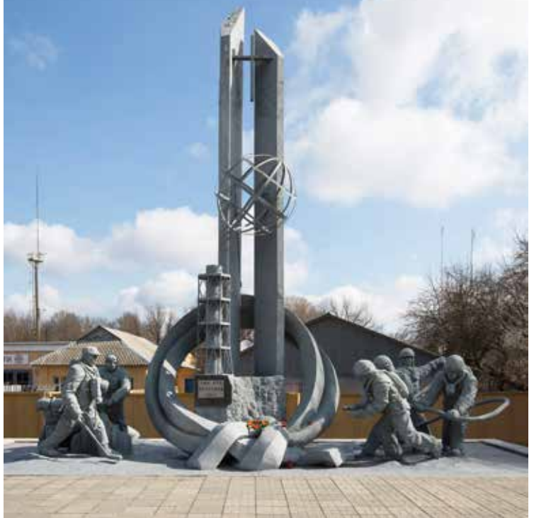
Herdenkingsmonument 'voor hen die de wereld hebben gered'.

Tsjernobyl is ook een toeristische attractie geworden. Het nucleair ramptoerisme zit in de lift. Het idee klinkt absurd, maar toch is er een markt voor. Zo'n tienduizend toeristen brengen jaarlijks een bezoek aan de dertig kilometer grote veiligheidszone rond de kerncentrale, waar korte dagtrips onder begeleiding zijn toegestaan. Men kan zelfs de kerncentrale bezoeken. Die wordt door de Oekraïense geheime dienst bewaakt vanwege de hoeveelheid uranium die nog aanwezig is en voor terroristische doeleinden gebruikt zou kunnen worden. De reizen zijn in 2011 gestopt omdat er discussie was over grote winsten die een ministerie erop maakte. In 2013 werden trips naar Tsjernobyl weer mogelijk via onder meer een aantal particuliere reisorganisaties. Toeristen betalen zo'n 115 euro voor een bezoek. Ze mogen niets aanraken en niet op de grond