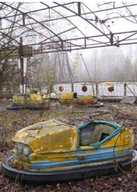
In Pripjat bij Tsjernobyl staan de botsauto's en het reuzenrad zoals ze in 1986 zijn achtergelaten.

Sinds eind 1991 zijn Sankovo en Medvezhye twee spookdorpen. Ze bestaan niet meer. Huizen zijn ingestort, wegen onbegaanbaar. Het onkruid staat meer dan manshoog. Dit is ongetwijfeld de triestigste