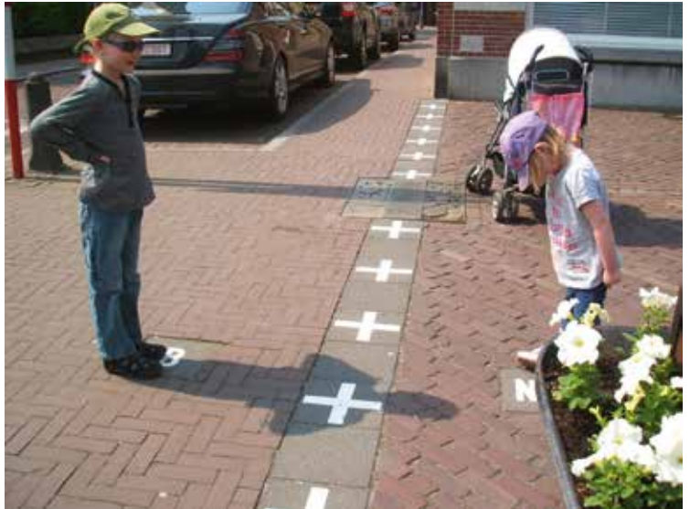
Curioso lo que pasa en este pueblo holandés. http://joveneseuropeos.blogspot.be

Deze uitzonderlijke enclavesituatie bestaat in Baarle al sinds de twaalfde eeuw. Waarom is de kaart van het dorp in de recente geschiedenis niet genormaliseerd? Op geen andere plaats in de wereld zijn delen van het grondgebied van twee landen zo met elkaar verweven als hier. In totaal hebben we tweeëntwintig Belgische enclaves in Nederland en acht Nederlandse enclaves in België. Al eeuwenlang bleef de situatie gehandhaafd omdat elke keer wanneer iemand die probeerde te veranderen, anderen