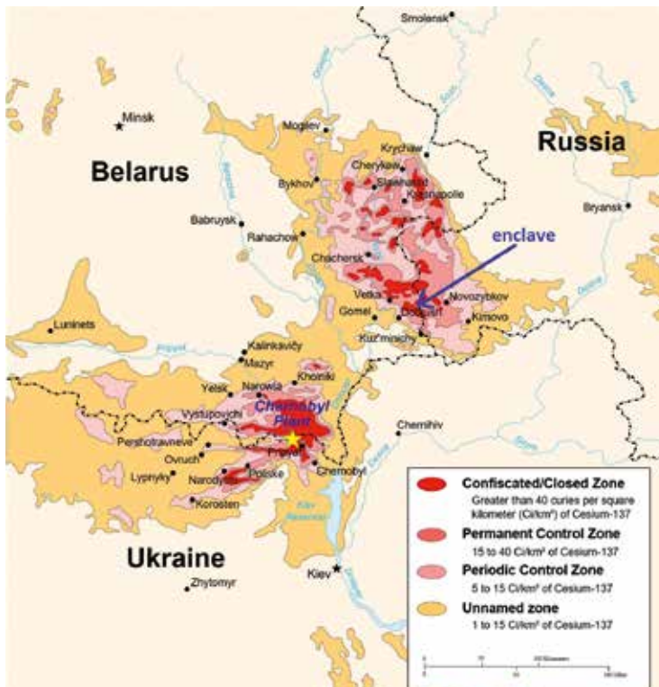
Stralingsmap na de kernramp.

Sinds de verboden zone rond de kerncentrale door de mens werd verlaten, heeft de natuur het gebied overgenomen. Wolven, elanden, bruine beren, wilde paarden, bevers en zwijnen bevolken nu de spookdorpen en zorgen paradoxaal genoeg voor een unieke biodiversiteit. Vroeger werd door de mens op deze dieren gejaagd en kwamen ze in veel lagere aantallen voor. Vandaag floreren zij. Schijnbaar hebben ze weinig last van de radioactieve straling, al vertoont hun DNA veel mutaties.