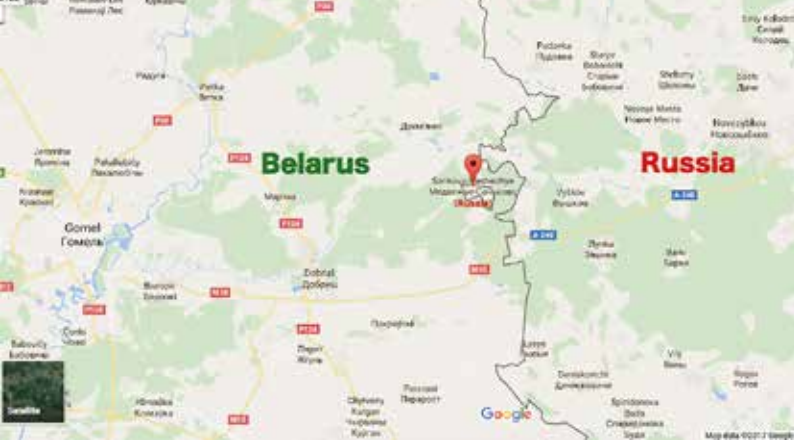
Russische enclave.

Sinds het voorjaar van 2014 zorgen de opstand van de door Rusland gesteunde separatisten in het oosten van Oekraïne en de annexatie van de Krim door Rusland ervoor dat Loekasjenko voorzichtig afstand neemt van Moskou. Rusland heeft de oliekraan naar Wit-Rusland deels dichtgedraaid, volgens Moskou omdat Wit-Rusland nog flink in het krijt staat bij het Russische energiebedrijf Gazprom. Maar er spelen ook politieke motieven mee: het Kremlin herinnert Loekasjenko op die manier eraan dat hij zich niet ongestraft