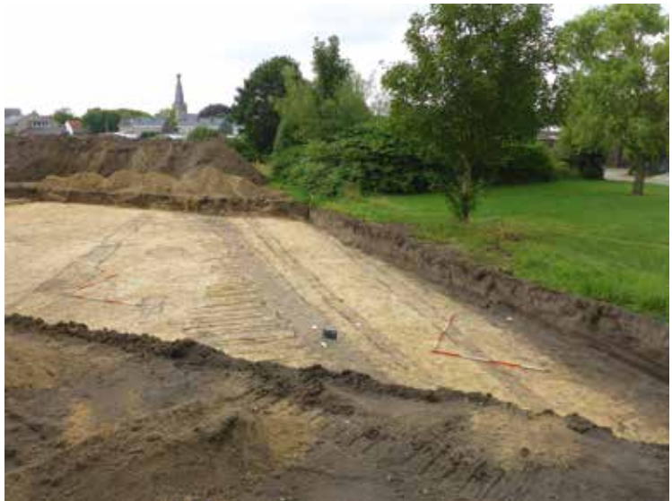
De (enclave)grensgreppels met ontginningsporen in noordoostelijke richting.