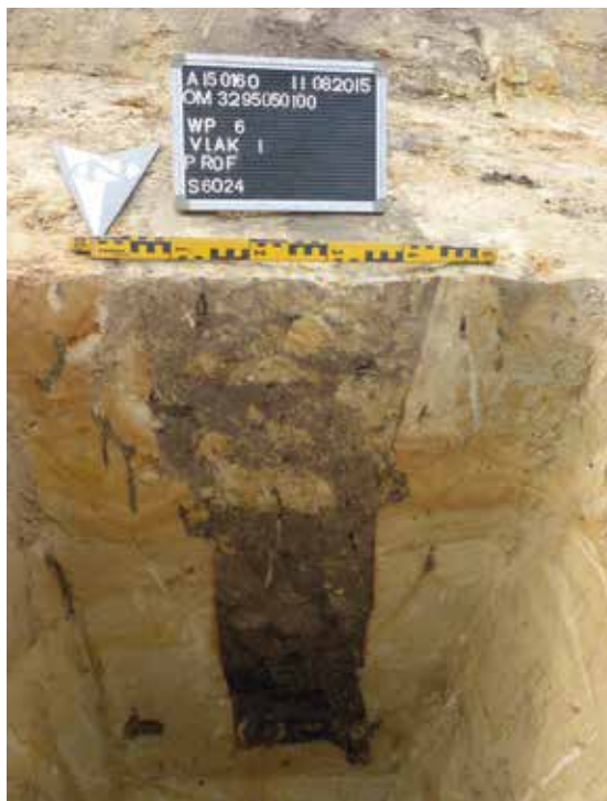
Doorsnede paalkuil afrostering.