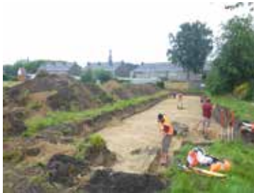
Het uitgraven van de grondsporen.

logen tot zo'n vijf jaar terug maar heel weinig oog hadden voor de Nieuwe Tijd. "Maar de laatste tijd we gaan ons steeds meer bezig houden met zaken uit de afgelopen twee eeuwen. Dat levert dan andere vragen op dan vroeger. Dan zijn tips van bewoners heel erg welkom. Misschien kunnen die een tipje van de sluier oplichten. Of de richting waarin we zitten te denken bevestigen."