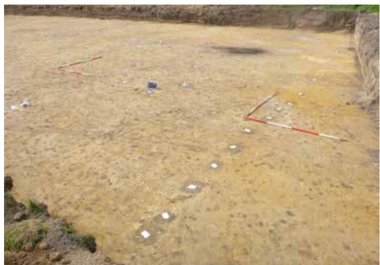
De zware afrastering.