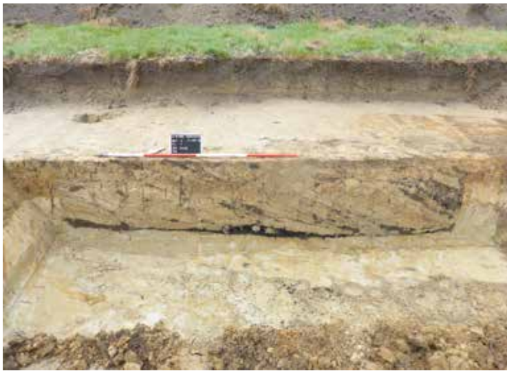
Doorsnede van de brandkuil met onderin de houtskool laag.

Parallel aan de van zuidwest naar noordoost lopende houtwal is nog een afrastering gevonden. “Deze is ergens tussen de late middeleeuwen en de 19e eeuw aangelegd.” Het is een lange aaneengesloten rij van dicht op elkaar geplaatste, diep gefundeerde palen. “Zo’n zware omheining zie je nooit!” Hij vraagt zich af of het te maken kan hebben gehad het spoor en het dichtbijgelegen station. “Met veetransport? Vee dat tijdelijk ingeschaard moest worden?”