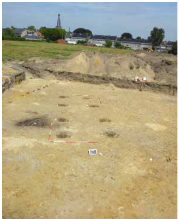
IJzertijdgebouwtjes met in de bovenhoek nog de zware afrostering.