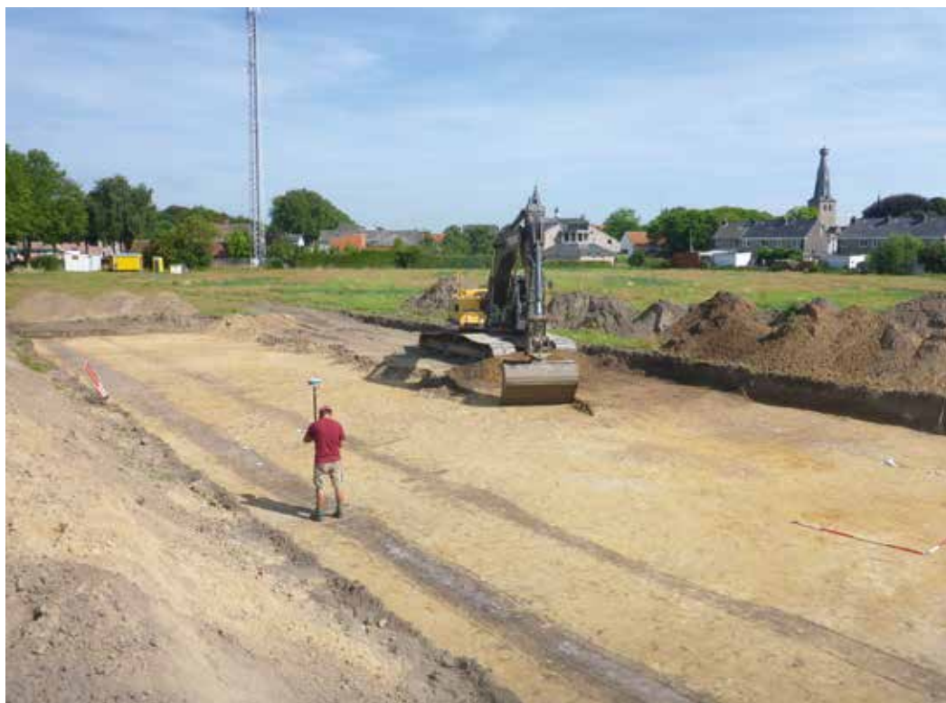
Aanleg van het sporenvak, met de door het terrein lopende greppels en bijgebouwtjes uit de ijertijd.

Reacties op het artikel en de vragen waarmee de archeologen bezig zijn graag naar het redactieadres vanwirskaante@amaliavansolms.org . Het definitief onderzoeksrapport zal nog even op zich laten wachten. Dit artikel is gebaseerd op de tussenresultaten zoals die worden opgenomen in het evaluatierapport.