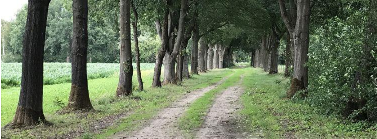
Lanenstructuur op Landgoed Hooghuys.