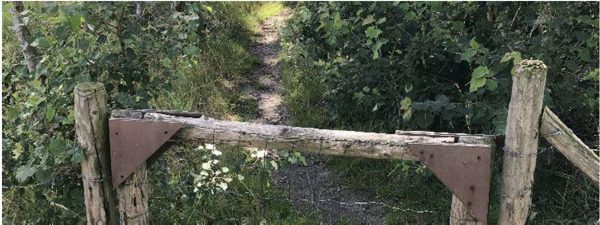
Oud paadje op de Maaijkant.