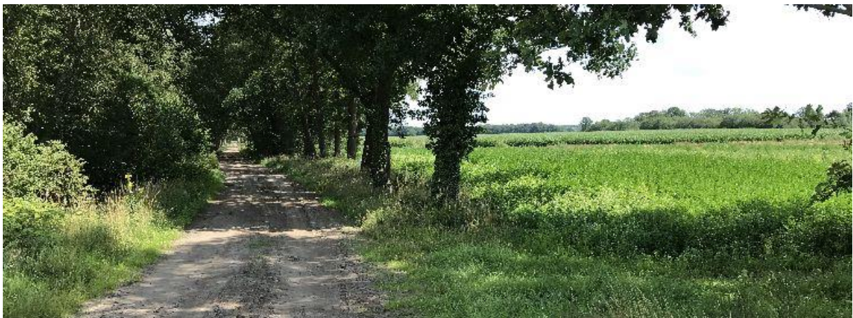
Beekdal van Het Groot Vergoor.