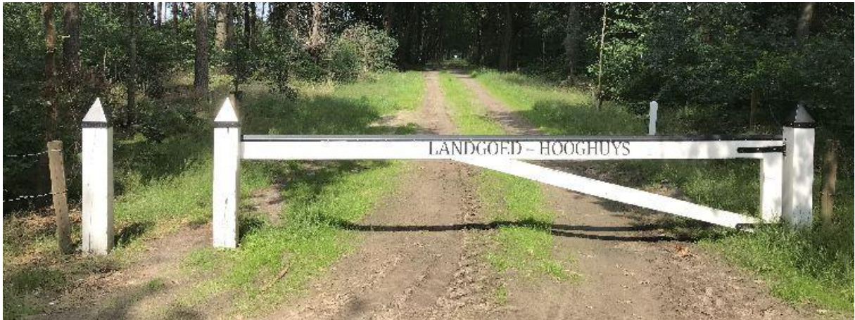
Witte toegangspoorten markeren het Landgoed Hooghuys.