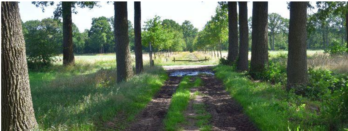
Langzaam wordt de beplanting langs de dreven vernieuwd.