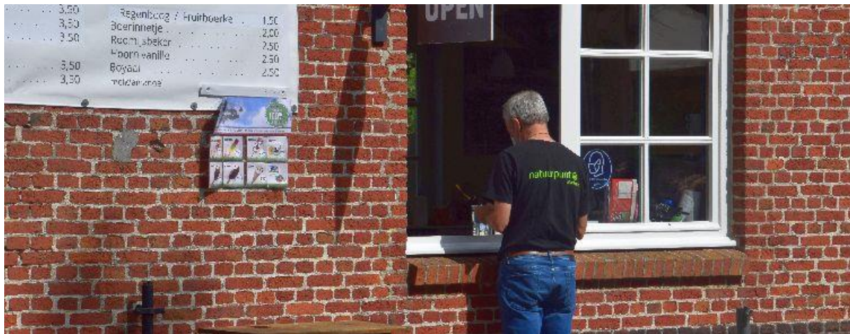
De Klapekster draait volledig op vrijwilligers.