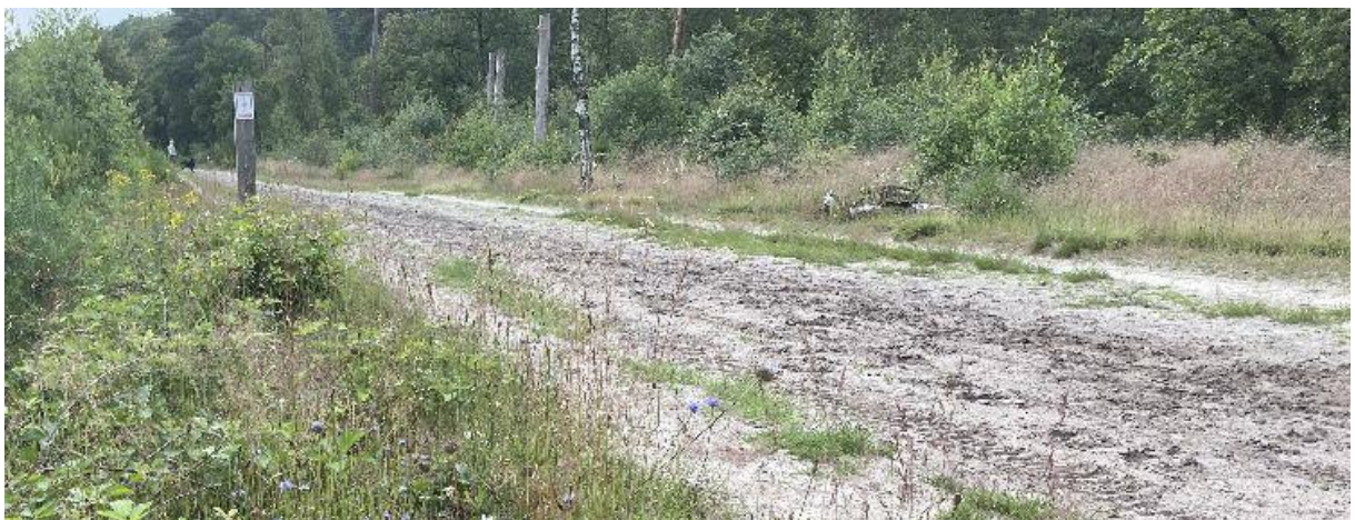
Oude Hoogstratensebaan, nog steeds een zandweg.