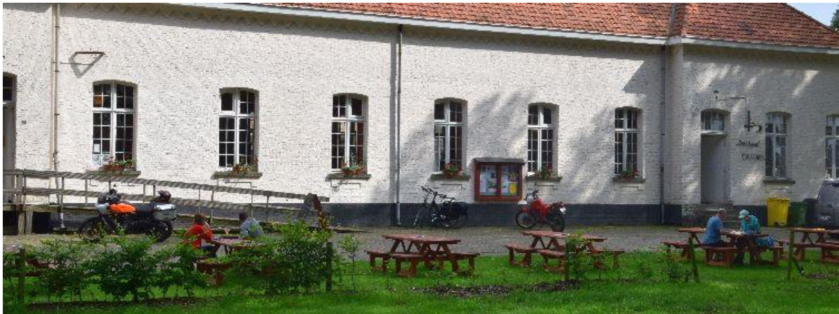
De Bayerd, een van de 4 Bâtiments.