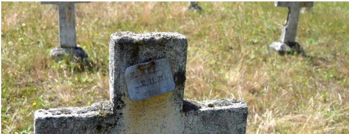
Met een nummer leefden de landlopers in Wortel-Kolonie... en stierven er.