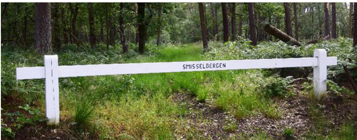
Op 13 oktober 2019 heeft Natuurpunt de wandelweg door Smisselbergen geopend.