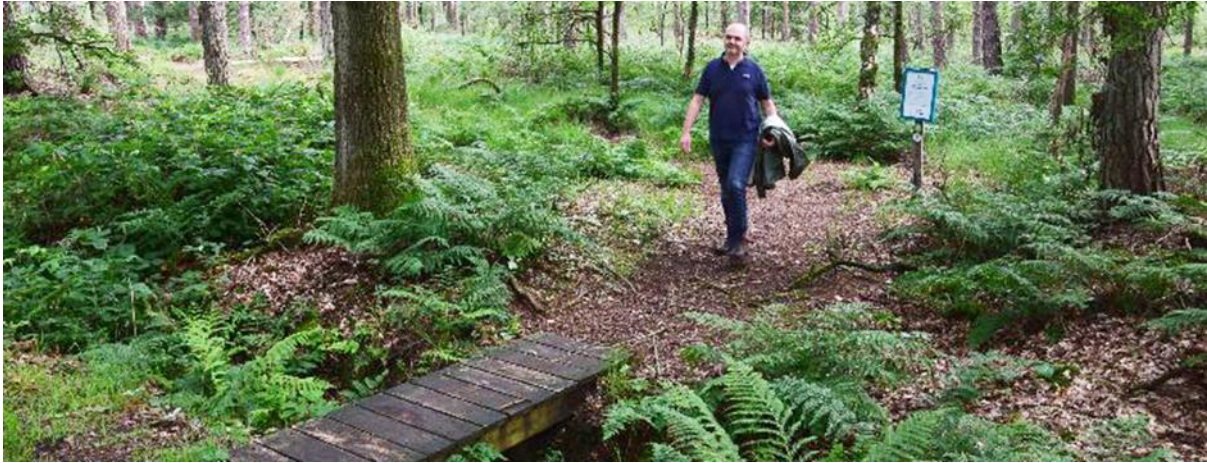
Het begin van het wandelpad door de Smisselbergen.