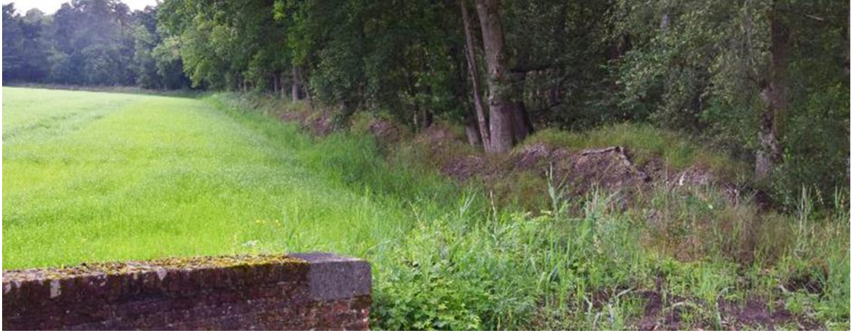
Langs de Moerloop is nog goed te zien dat er flink wat grond is afgegraven.