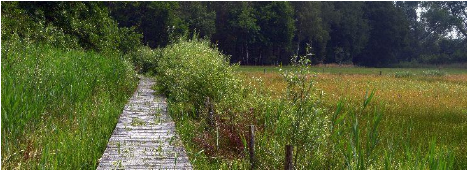
Het knuppelpad maakt een mooie kortsluiting in de Ruitervelden mogelijk.

De route is 6,5 km lang: start bij knooppunt 50 – 20 – 25 – 19 – 51 – 34(grens) – 35 – 33 (grens) 52 – 41 – 60 – 50. Onderweg kom je drie bankjes tegen waaronder het boomstambankje. Op het Vlaamse bankje mag je sinds twee weken ook weer uitrusten.