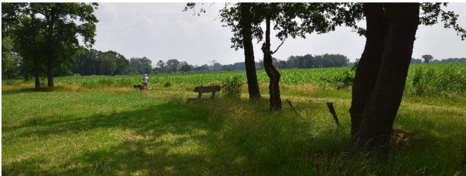
Zicht vanaf het boomstambankje op het beekdal.