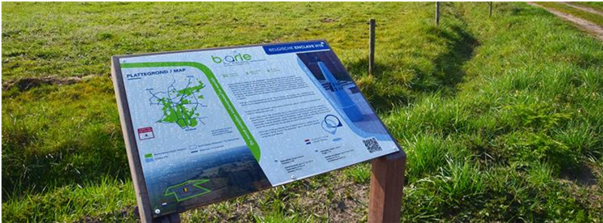
Enclave H18 midden in het buitengebied langs het zandpad Manke Gooren.