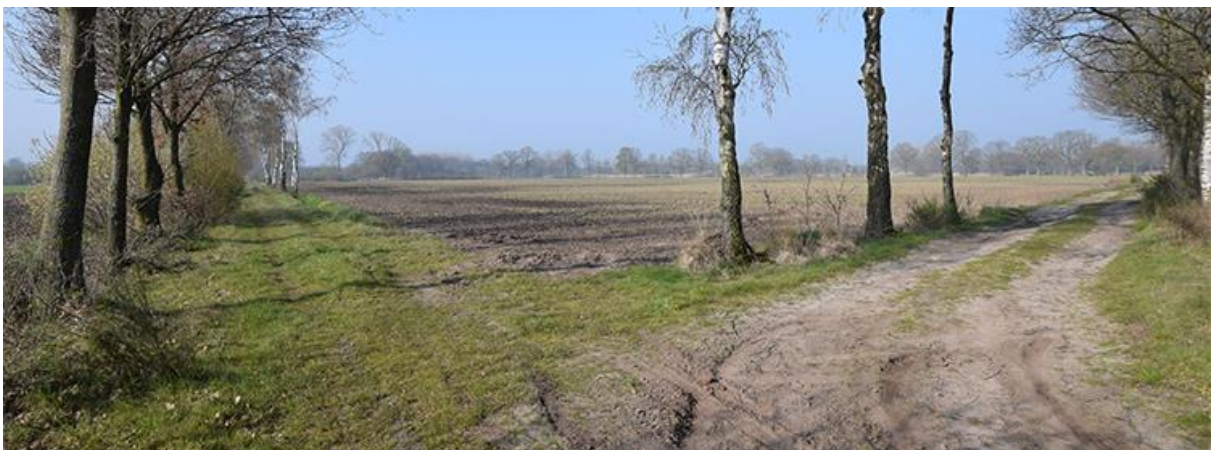
Het zandpad 'Manke Gooren' loopt rond de akker.