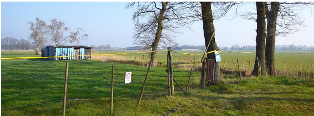
Het enclavebord H18 staat ver van de enclave vandaan. Later kom je er op het ommetje vlak langs.