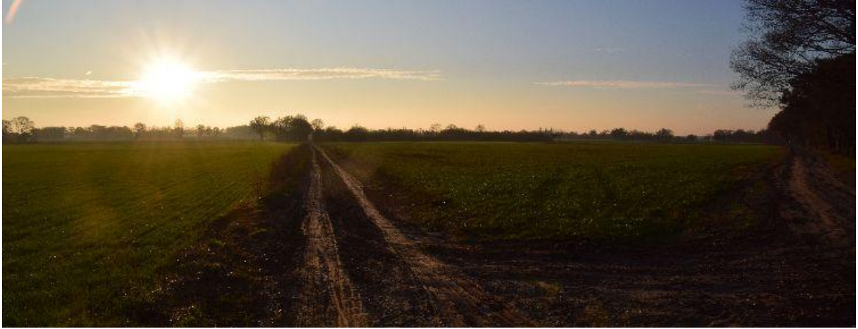
De Schepersdam aan het einde van een zonnige winterdag.