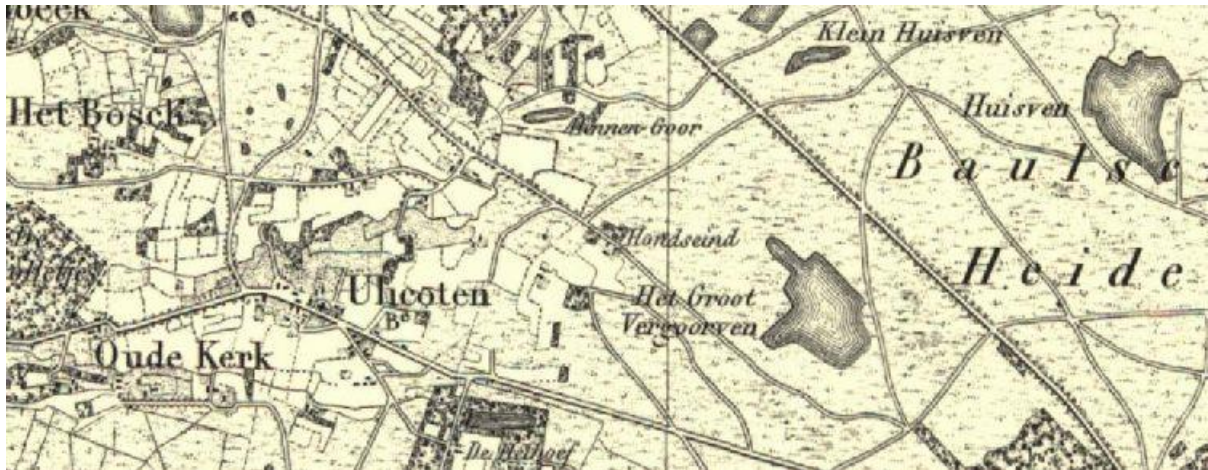
Het Groot Vergoorven lag rond 1870 nog midden op de hei tussen de Oude Baan en de weg naar Ulicoten.