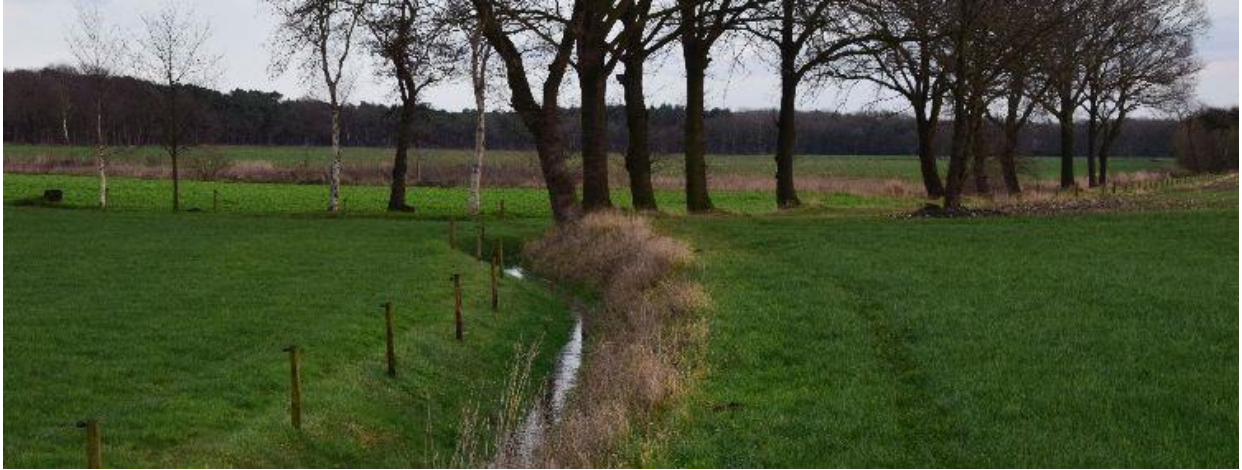
Het Groot Vergoor ter hoogte van de Maaijkant.