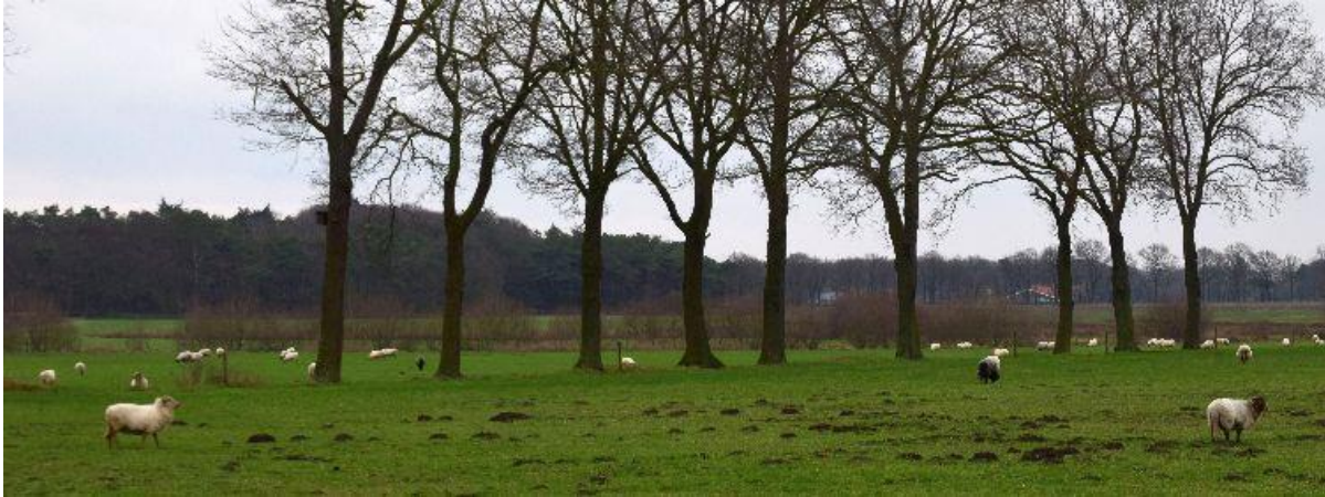
Achter de bomenrij ligt Het Groot Vergoorven.

Een goor is een moeras met venige bodem of een zeer waterrijk moeras. Als waterrijk moeras is Het Groot Vergoorven nog op de kaart van rond 1850 ingetekend, met het Huisven aan de andere kant van de Bredaseweg als een van de grootste vennen in de wijde omgeving. 'Ver' in Vergoor zou op onvruchtbaar kunnen wijzen of op de afgelegen ligging.