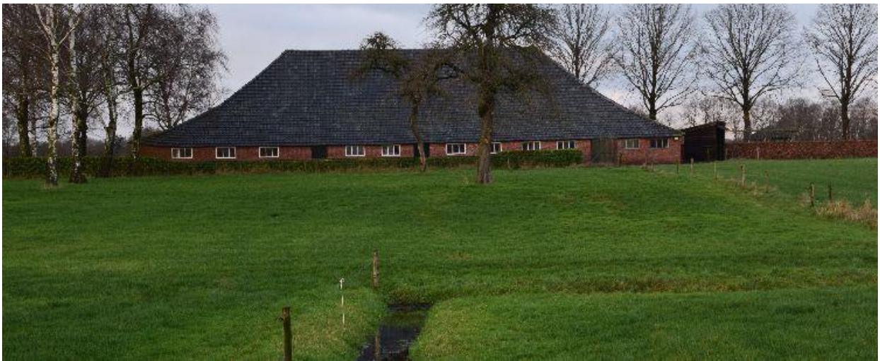
Ook langs Het Groot Vergoor vind je af en toe best grote hoogteverschillen.