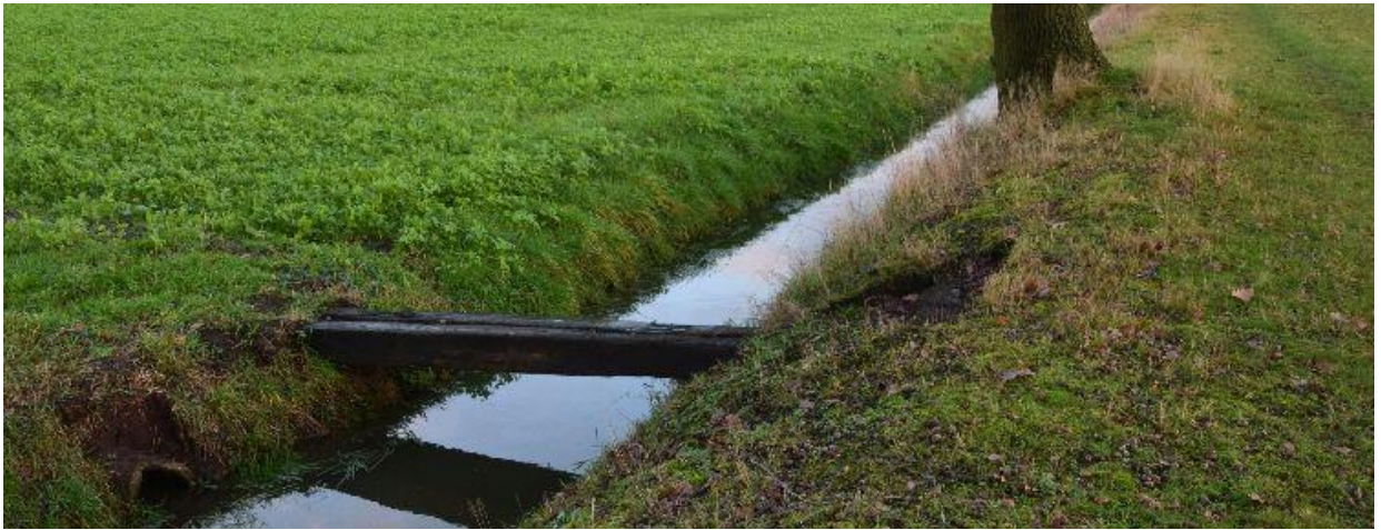
Het Groot Vergoor is zeker geen grote beek.