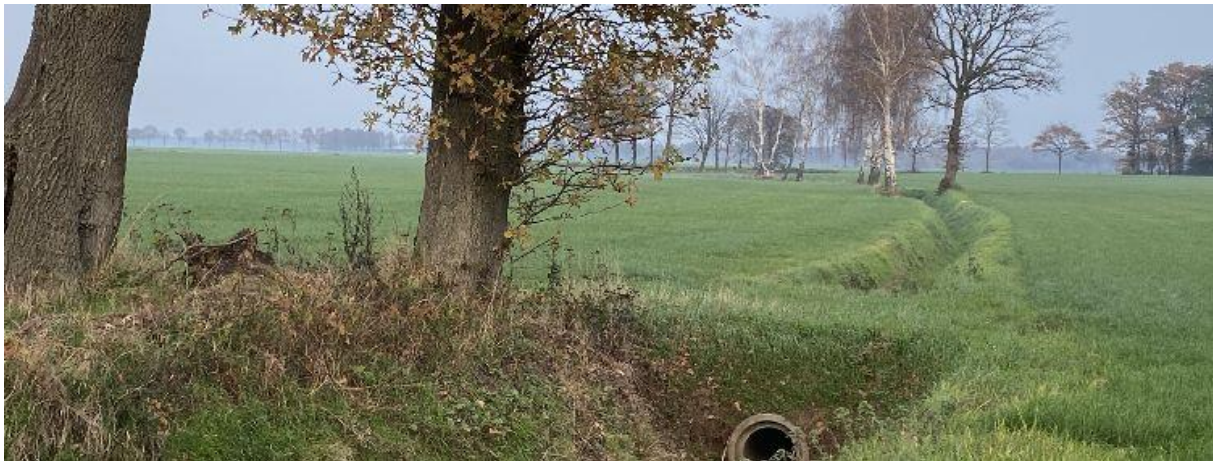
Vlak voor Groot-Bedaf stroomt dit beekje naar de Poppelse Leij.