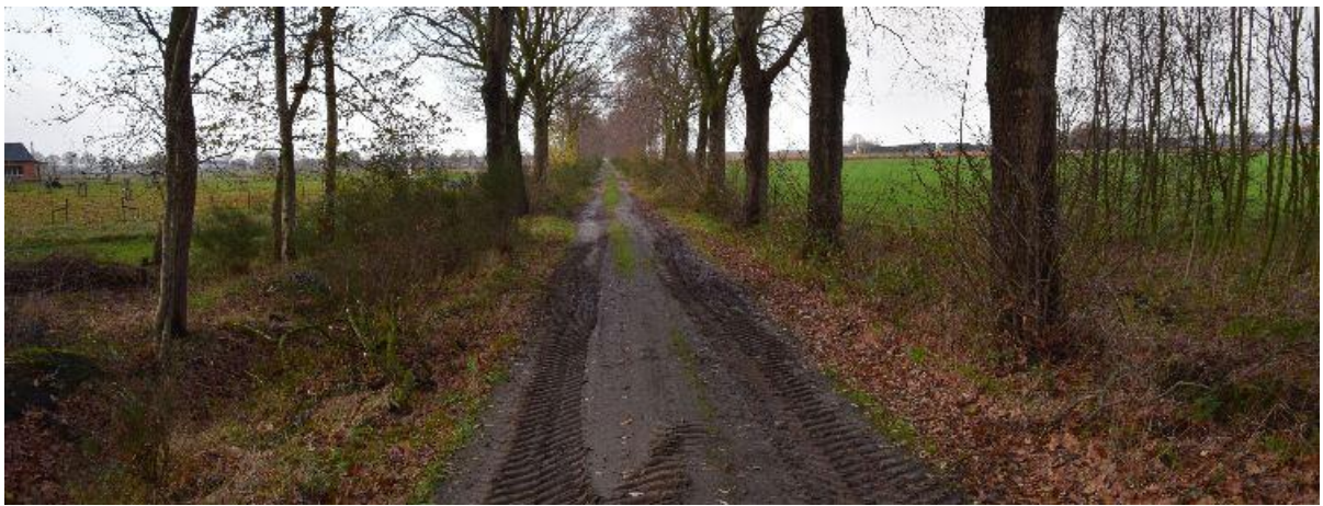
Oude ontginningsdijk in Klein Bedaf.