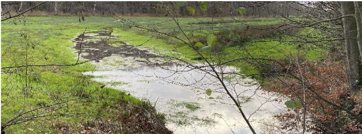
De Oude Leij nog geen twee kilometer stroomafwaarts tussen De Hoevens en het Ooievaarsnest.