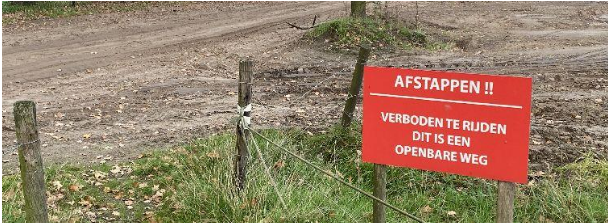
Over deze aankondiging moet je even nadenken.