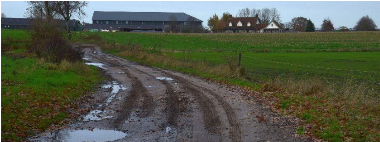
Het dal van de Leij (Donge) bij Het Sas. Tot 30 jaar terug liep er vanaf de beek een pad recht naar Het Sas.