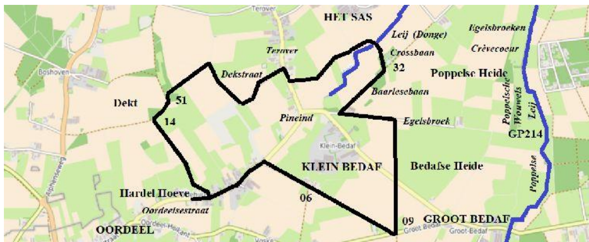
Routekaartje met enkele oude toponiemen op de Poppelse Heide.

Startpunt is bij de Hardel Hoeve, Oordeelsestraat 17. Je mag er je auto op de parking zetten. Loop dan de Oordeelsestraat iets verder op en sla na huisnummer 19 linksaf het zandpad in. Dan zit je op het netwerk: op een houten paal zie je een netwerkschildje met nummer 14. Vanaf knooppunt 14 naar 51 – 32 – 09 – 06 – 14. De route is 8,5 km lang.