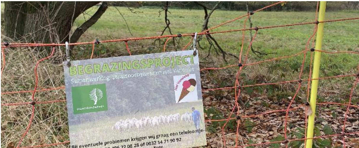
Het Vaneleke werkt samen met Staatsbosbeheer