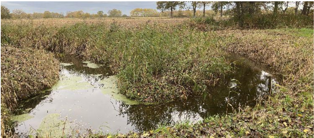
Het Merkske kronkelt enorm