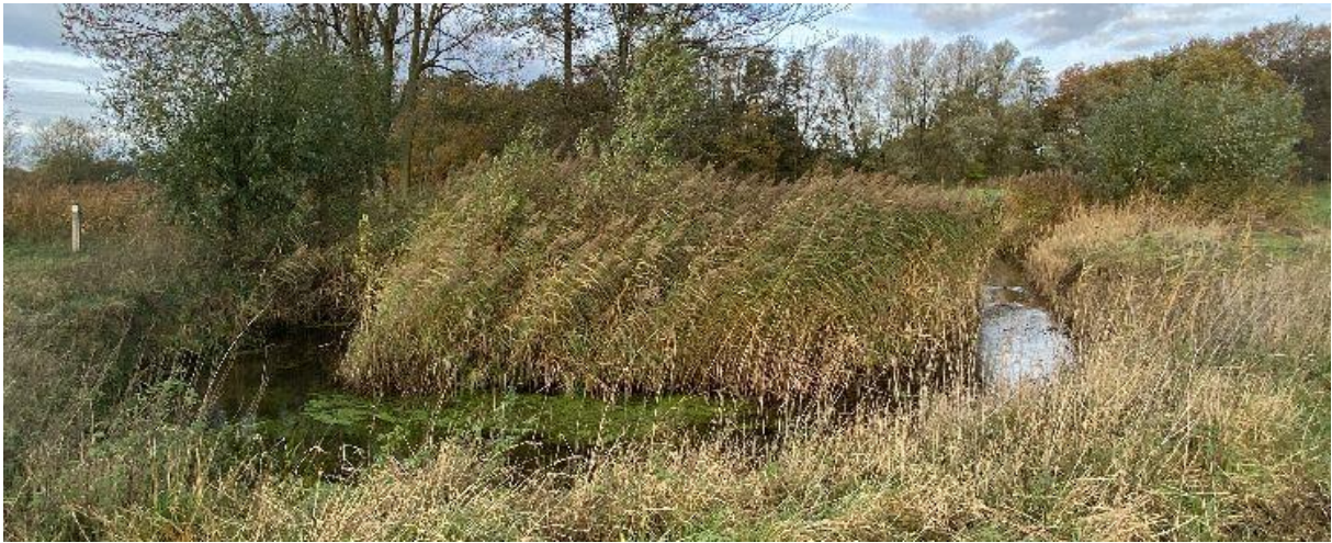
Stroomkuil in Het Merkske