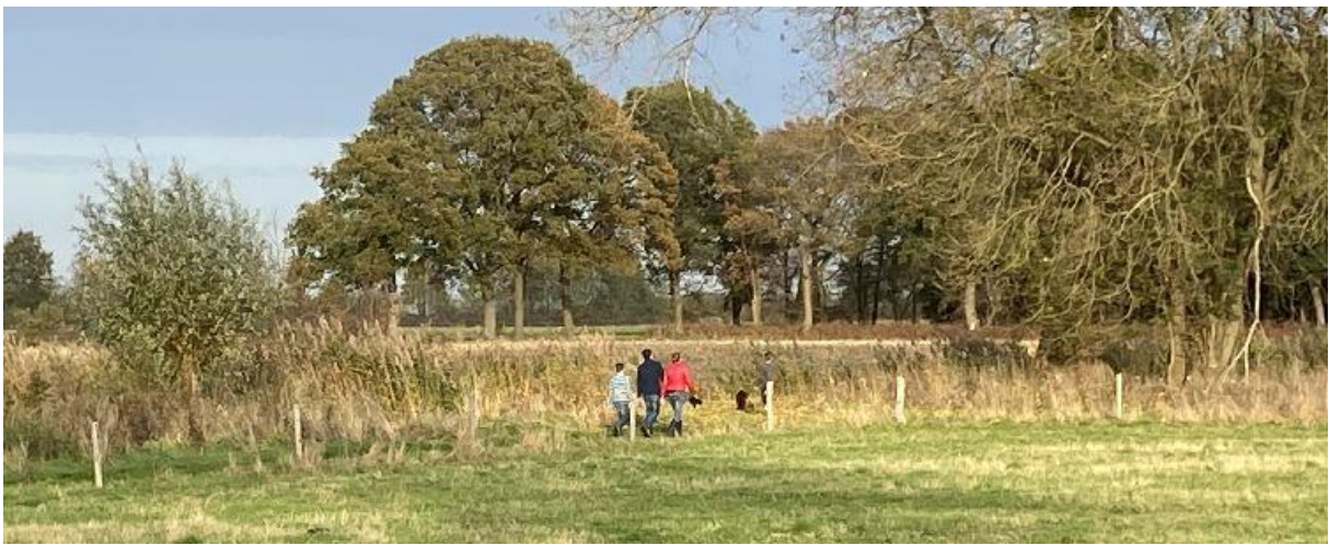
Veel wandelaars hebben de Vallei van Het Merkske al weten te vinden