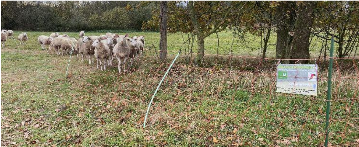
Begrazingsbeheer met Kempische heideschappen bij het Vorster Schor