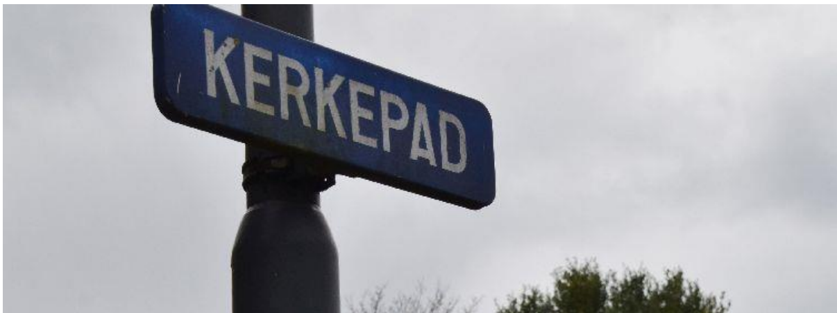
Kerkepad in Ulicoten.