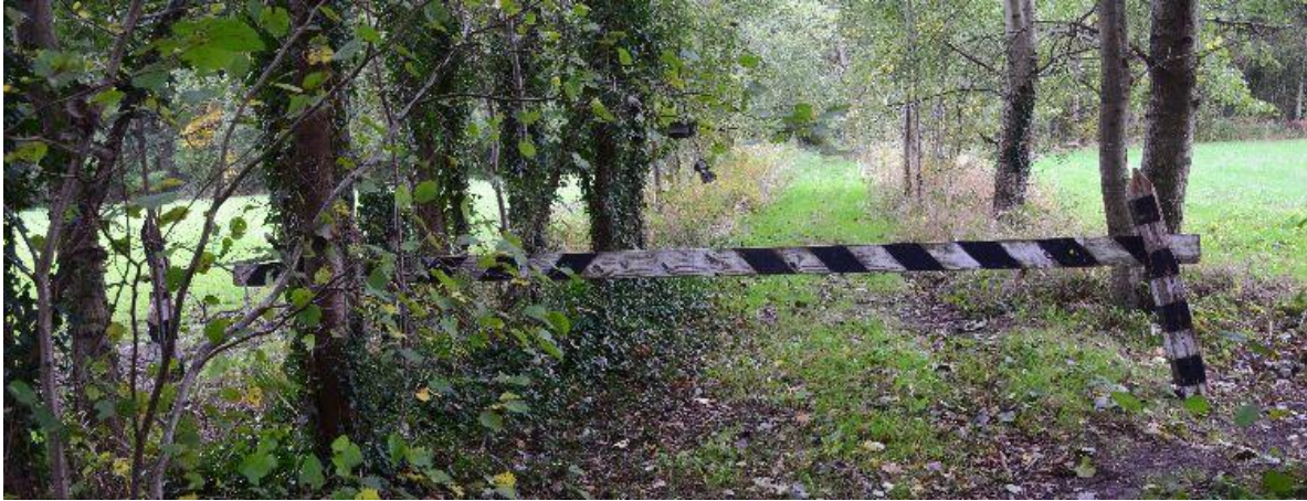
Net over de grens is de oude weg naar Meer met een slagboom afgesloten.