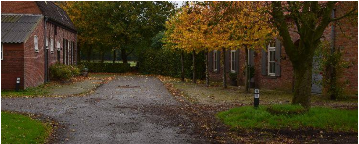
Tussen de huizen liep je vroeger zo 'den ouwen pad' naar Ulicoten op.