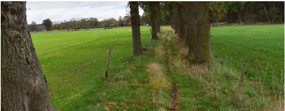
Het Withagenpad geeft een idee van het vroegere kerkepad van de Nieuwe Strumpte.