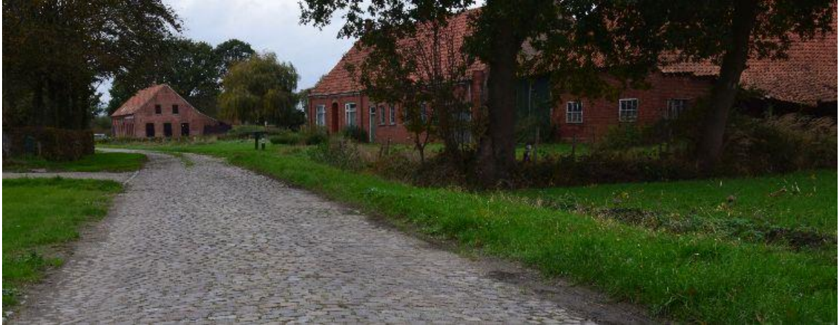
Op een klein stukje van de Nieuwe Strumptebaan liggen nog kasseien.