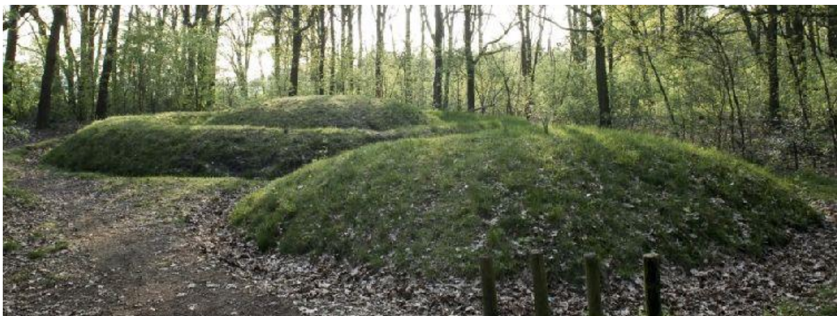
Gerestaureerde grafheuvel tussen Veldhoven en Vessem.