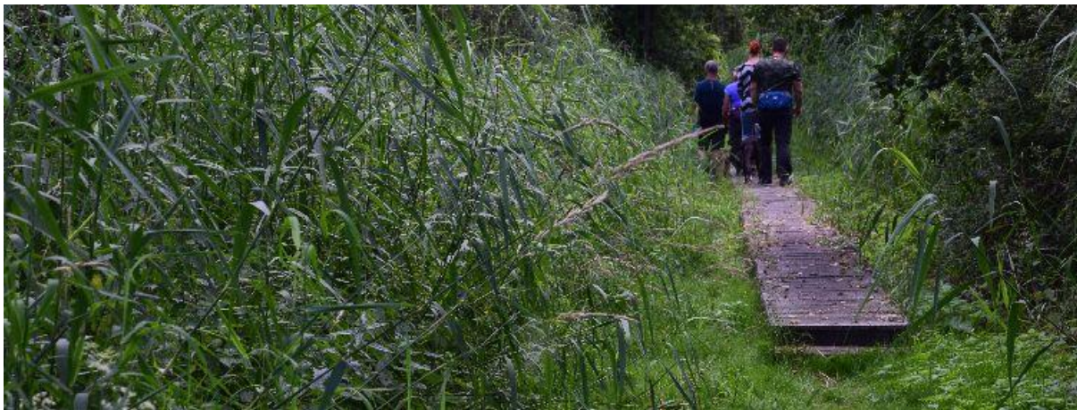
Laarzenpad met vlonders in Het Moer.