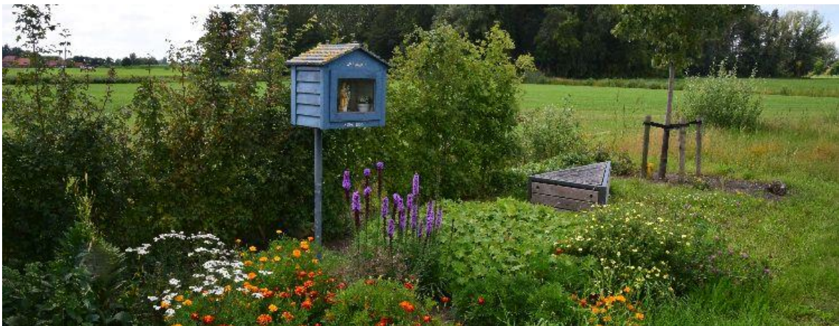
Kapelletje langs het Kerkebospad.