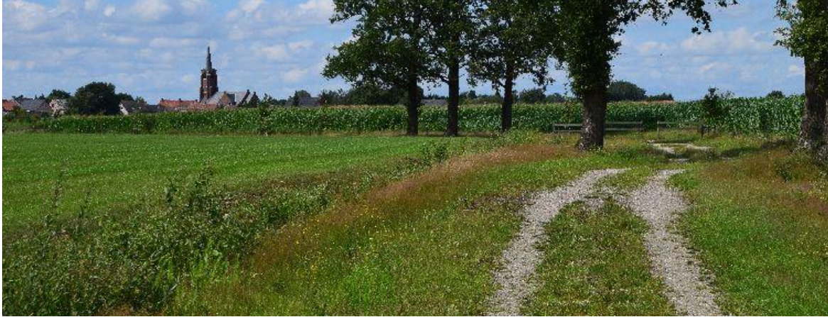
Het Kerkebospad is in de ruilverkaveling aangelegd.

De Noordermark ontspringt in Het Moer bij het Lipseinde. Vanaf de kerk in Zondereigen voert dit ommetje je naar het Zondereigense Kerkemoer en het in Merksplas gelegen Moer.