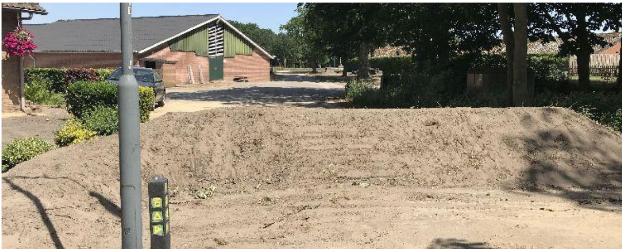
Om de bedrijfsgebouwen in het Hoogeind is een omleiding voorzien.