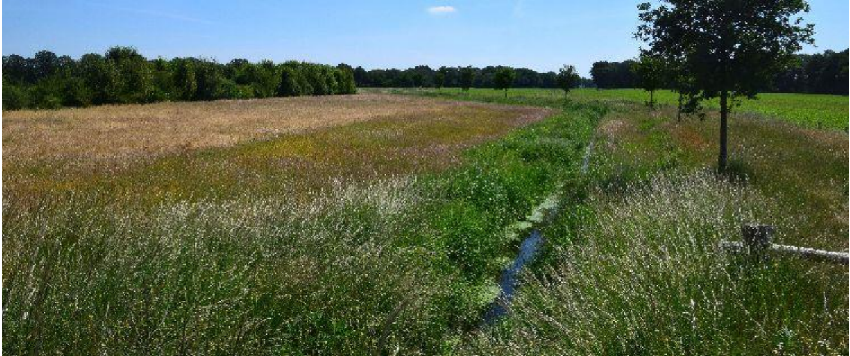
Langs de Bremer ligt een ecologische verbindingszone.