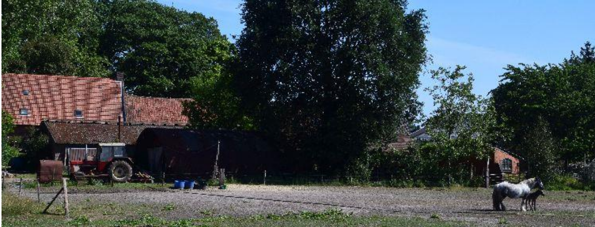
Kijk eens achterom als je de Loverense Akker oploopt.