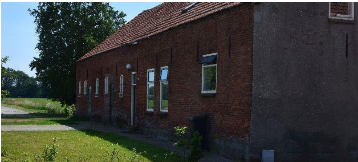
Voor de Heihoef langs liep de zomerroute naar Baarle.