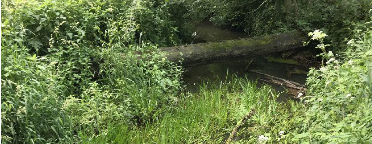
Omgevallen bomen blijven liggen in Het Merkske om het water langer vast te houden.