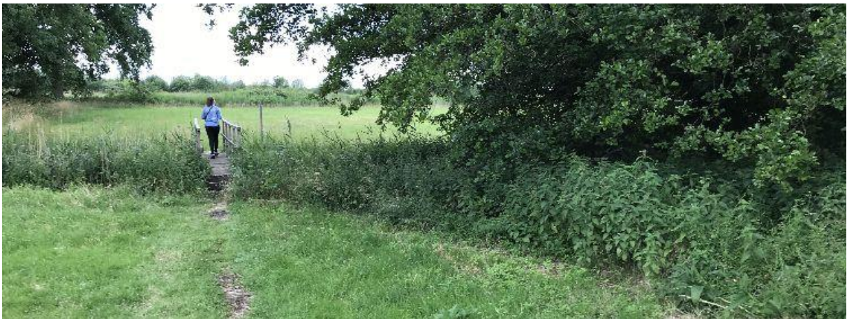
Voetbrug over Het Merkske.