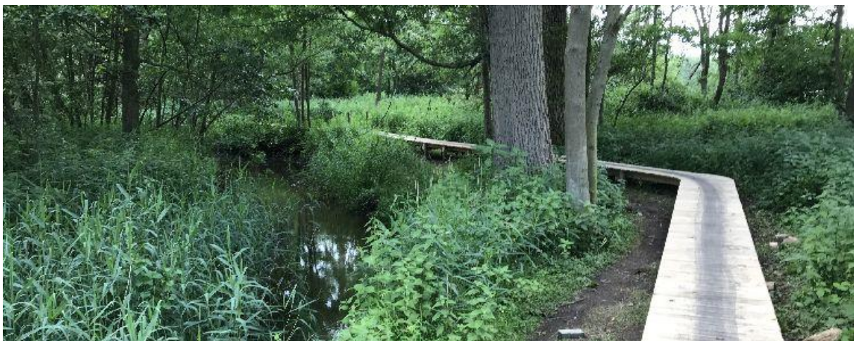
Het nieuwe knuppelpad langs Het Merkske, met de kruitwagen moest het materiaal worden aangevoerd.