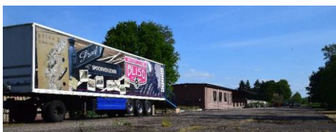
De BL150-trailer staat nu op het perron in Baarle-Grens.