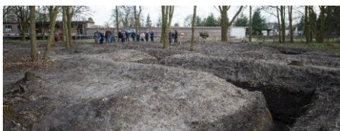
Door de eerste loopgraaf mag je lopen.