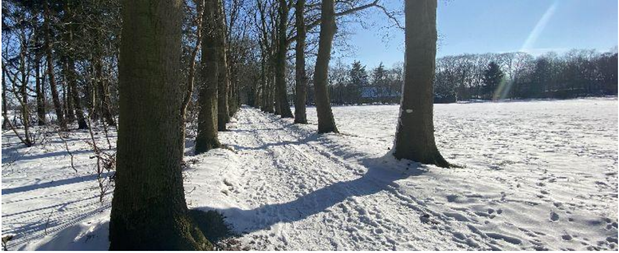
Doorgaand pad in de Huisvennen.