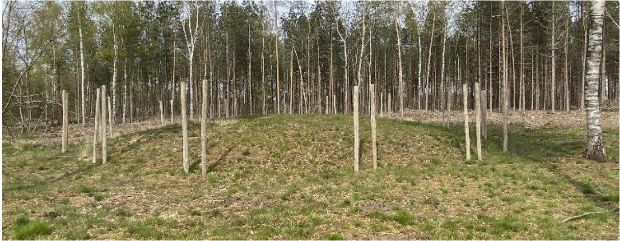
Paalkransheuvels komen niet vaak voor.