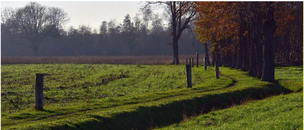
Palen verhinderen dat het pad bij de akker wordt getrokken.