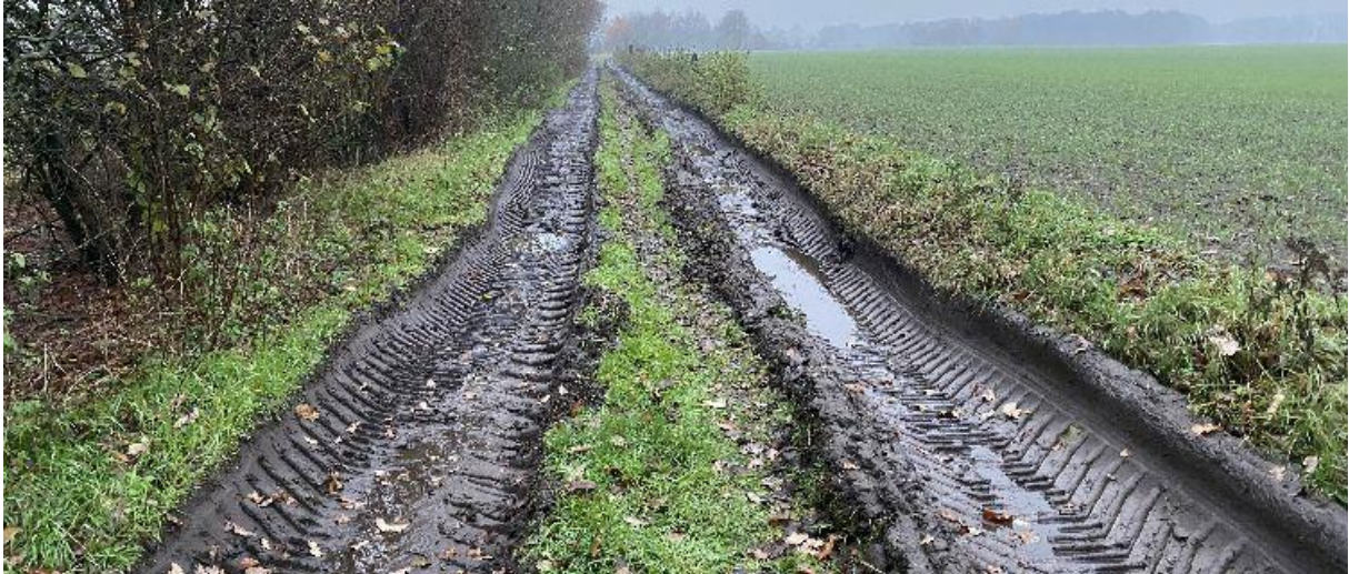
Diepe sporen in het pad langs de Schouwloop.