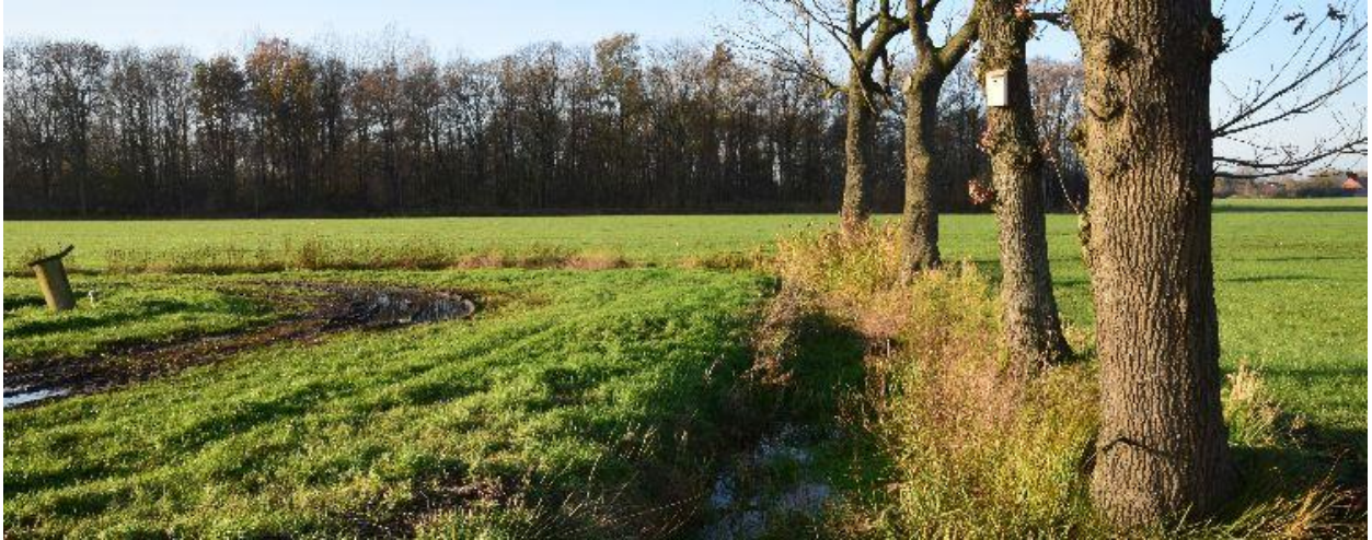
Het Gels Loopke stroomt bij het Kerkemoer in de Noordermark.