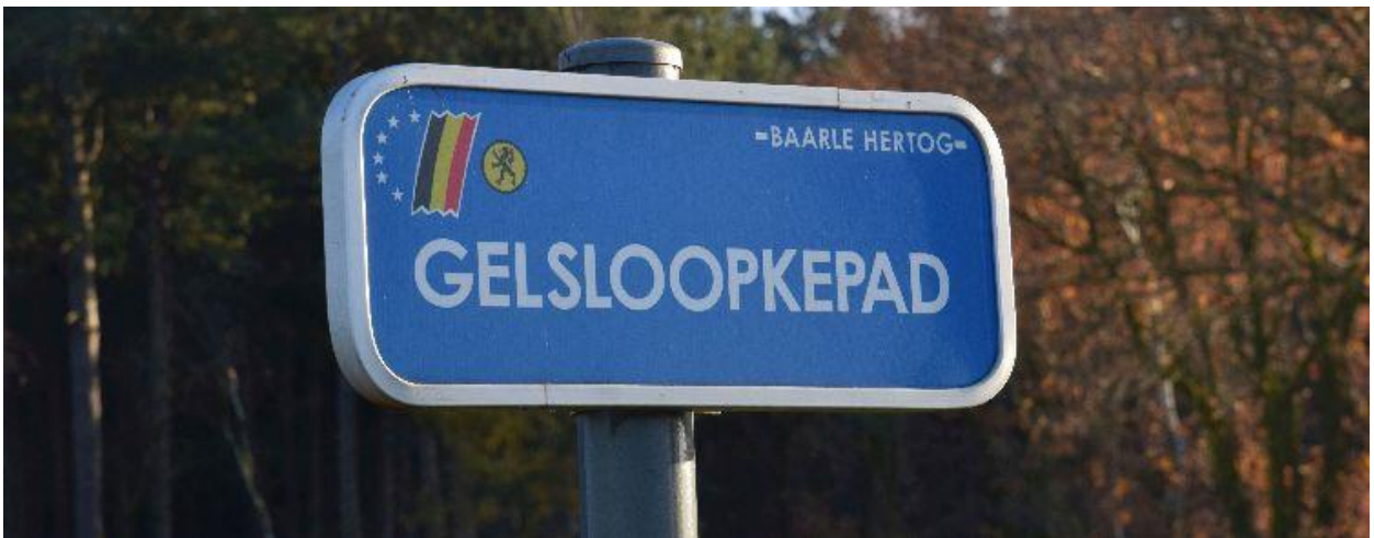
De gemeente Baarle-Hertog heeft de ruilverkavelingspaden van een naam voorzien.