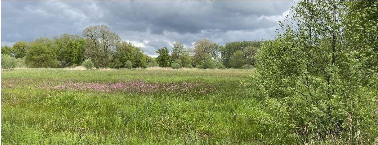
De Heikantse Beemden liggen bij de Witte Kei in de gemeente Baarle-Hertog.