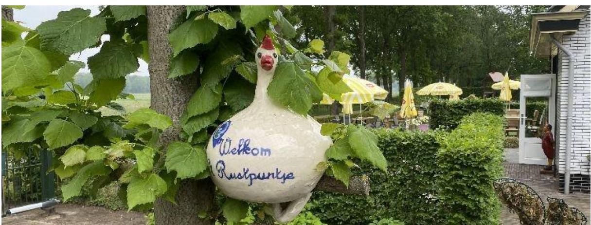
Welkom op het terras.