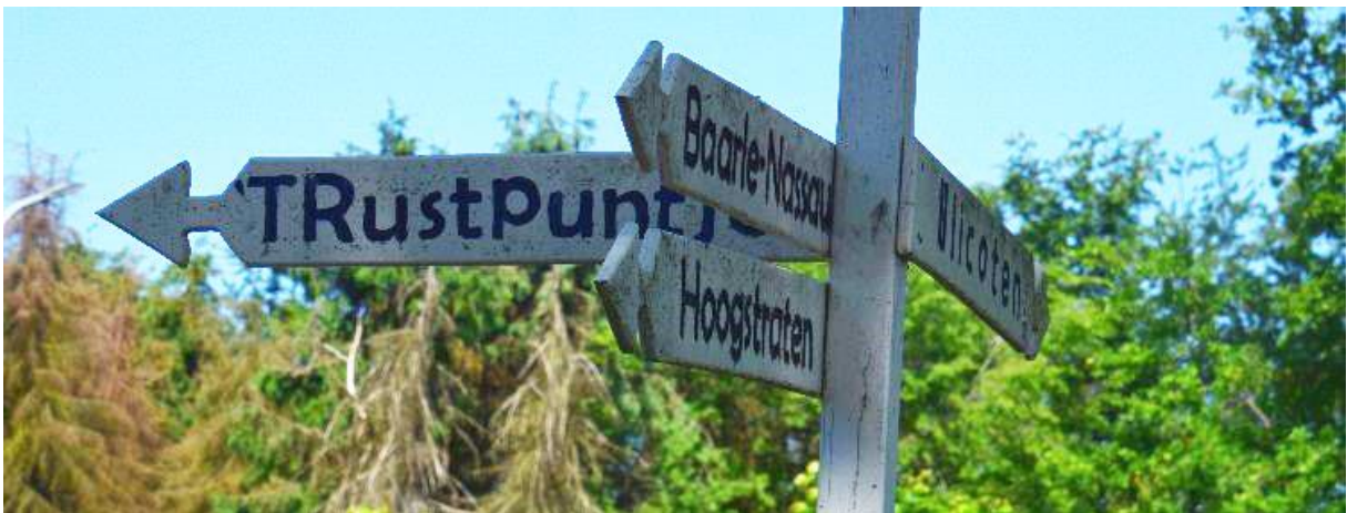
Het startpunt bij 't Rustpuntje ligt tussen Baarle-Nassau, Hoogstraten en Ulicoten.